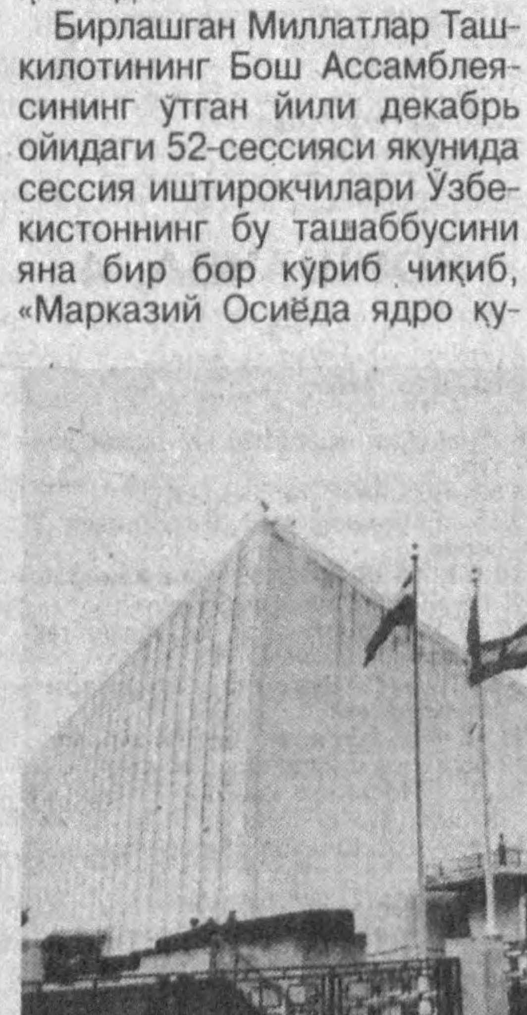
Бирлашган Миллатлар Ташкилотининг Бош Ассамблеясининг ўтган йили декабрь ойидаги 52-сессияси якунида сессия иштирокчилари Ўзбекистоннинг бу ташаббусини яна бир бор қуриб чиқиб, «Марказий Осиёда ядро қу-

лакатлар раҳбарлари ҳам қўллаб-қувватлашди. Шу тариқа Тошкент халқаро анжуманида Марказий Осиё давлатлари ташқи ишлар вазирларининг минтақани ядро қуролидан ҳоли зонага айлантириш тўғрисидаги қўшма баёноти қабул қилинди.