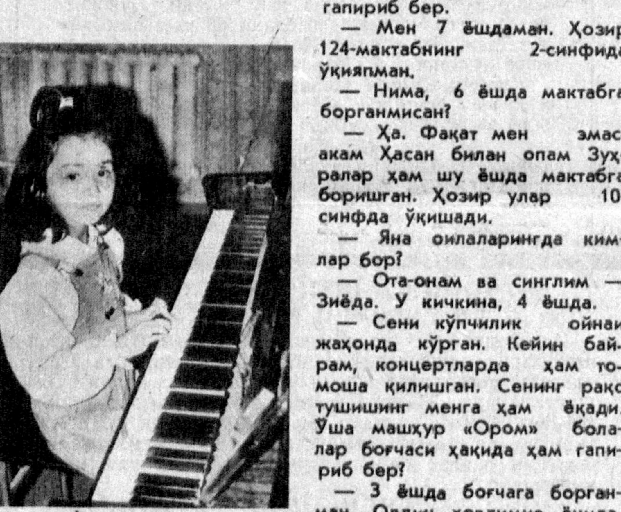
Захронининг умид гунчалари