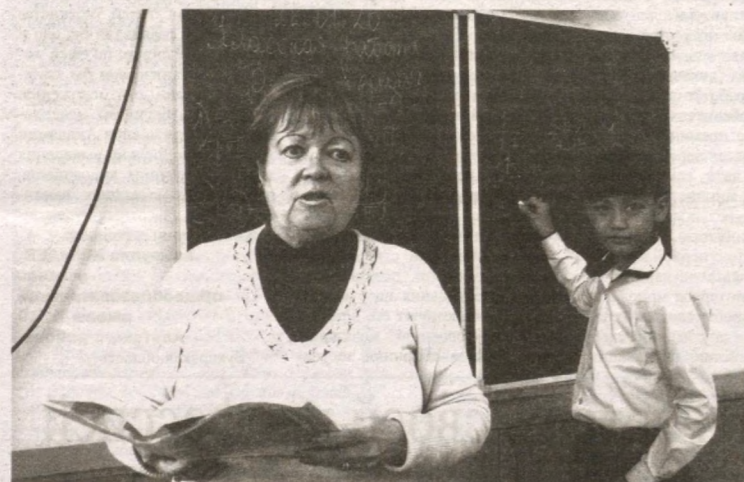
Одной из актуальных задач сегодня является формирование у молодого поколения активной жизненной позиции, умений отстаивать свою точку зрения, уважать мнение собеседника, правильно, четко и лаконично формулировать свои мысли.

В современном мире любому человеку необходимо быть творческим, самостоятельным, ответственным, коммуникабельным специалистом, способным решать возникающие проблемы. У таких людей есть потребность к познанию нового, умение ориентироваться в огромном мире информации, собирать необходимый материал. Все эти качества можно с успехом формировать в системе школьного образования, используя компетентностный подход в преподавании учебных дисциплин. Это является необходимым условием совершенствования работы по воспитанию самостоятельности учащихся, решения главной задачи — воплощения личностных и социальных смыслов образования.