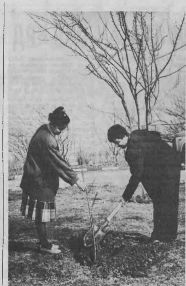
● КУРЛАМЯнинг янги иссиқ кўшлари бошланғич билаёқ ҳамма ерда кўчат экиш, бор яратиб ишлари бошлаб юборилди.

чи ва полвоилар, кўплаб фольклор-этнограф гуруҳлари ўз санъатларини намойиш этадилар.