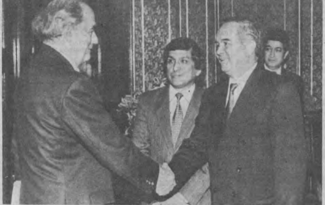
(Ў.А.) Сурагда: қабул пайти.

боллари ҳусусида сузлади. — Ўзбек ишбилармонларининг француз ҳамкасблари билан яқин муносабатлари йўлга қўйишга иштироки билан, — деди Ислам Каримов. — Биз Франция Президентини Франсуа Миттеран жанобларининг юртимизга сафари асосидаги эсининг таърифига эътибор беришимиз керак. Ф. Жискар Д'эстен Ўзбекистон Республикаси Президентининг Францияга сафаридан сўнг французларнинг Ислам Каримов қўллаётган сиёсатга нисбатан муносабатлари юз берганини таъкидлади. — Ўзбекистон таялаган