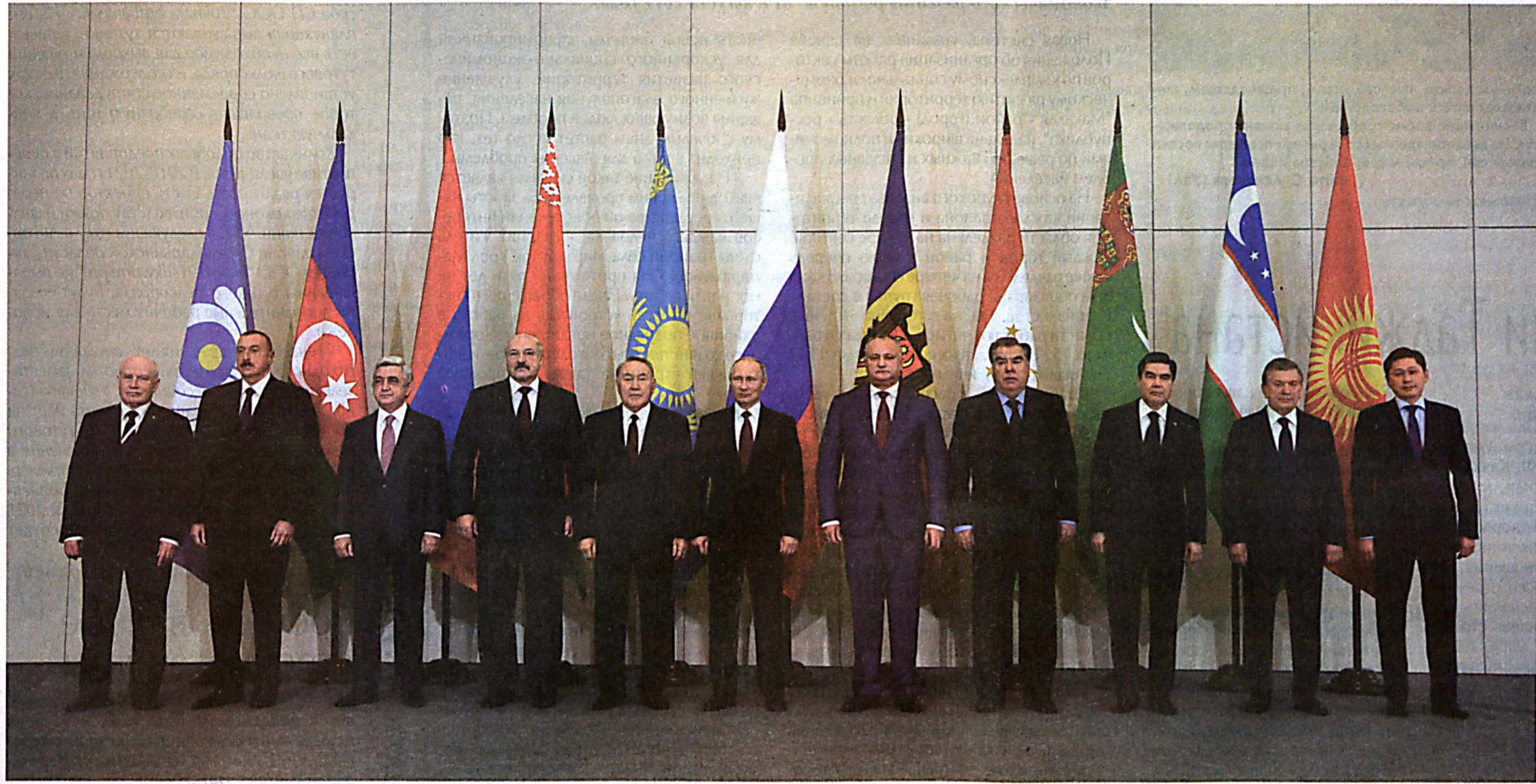
Президент Республики Узбекистан Шавкат Мирзиёев 10-11 октября 2017 года принял участие в заседании Совета глав государств-участников Содружества Независимых Государств в российском городе Сочи.

Основные мероприятия саммита состоялись 11 октября.