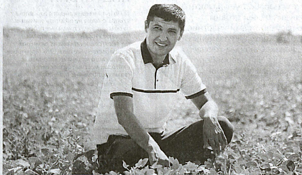
■ Фермерское хозяйство "Вангози агро" Кызылтепского района Навоийской области успешно выполнило договорные обязательства по заготовке хлопка, сдав на государственный хирман 115 тонн "белого золота" вместо запланированных 108 тонн. Хозяйство, достигшее хороших результатов в зерно- и хлопководстве, эффективно занимается также

кролиководством, пчеловодством, птицеводством, животноводством и рыбоводством.