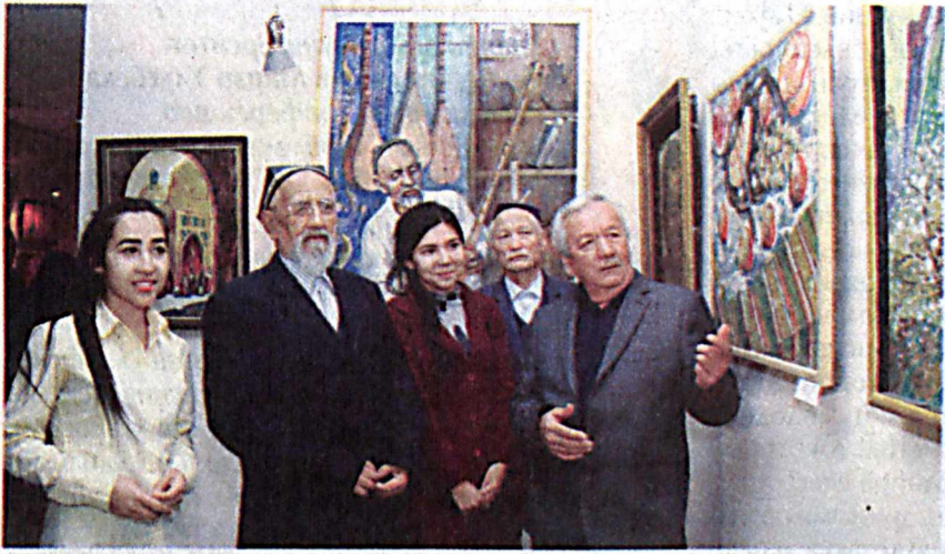
В Государственном музее искусств Узбекистана открылась выставка работ известного художника Рахимжона Ризамухамедова и его учеников.

В рамках выставки собраны лучшие работы Р. Ризамухамедова, созданные в самые разные годы его деятельности. Мастер кисти в своих картинах отдаёт