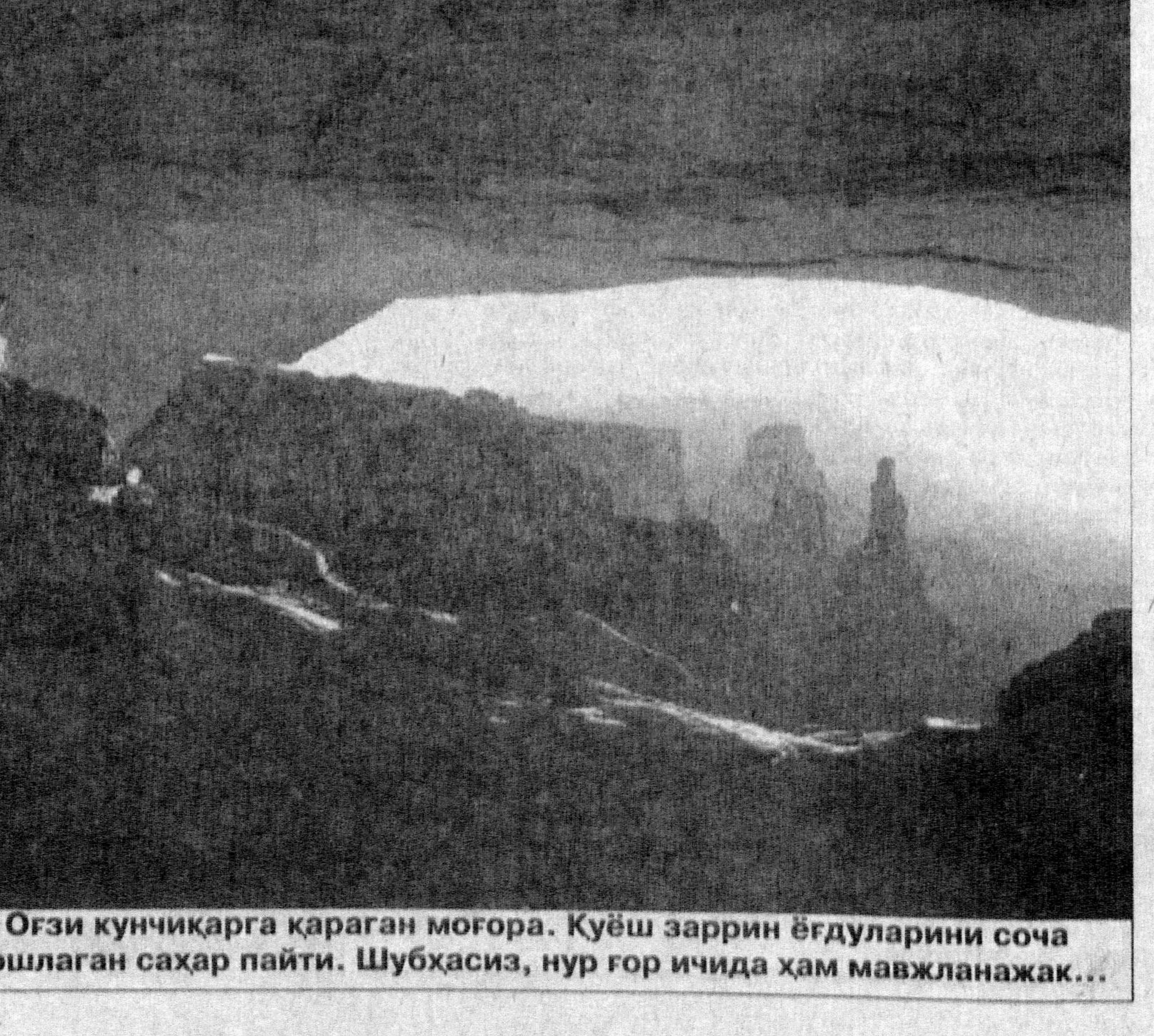
Оғзи кунчиқарга қараган моғора. Қўёш заррин ёғдуларини соча бошлаган саҳар пайти. Шубҳасиз, нур гор ичида ҳам мавжланажак...