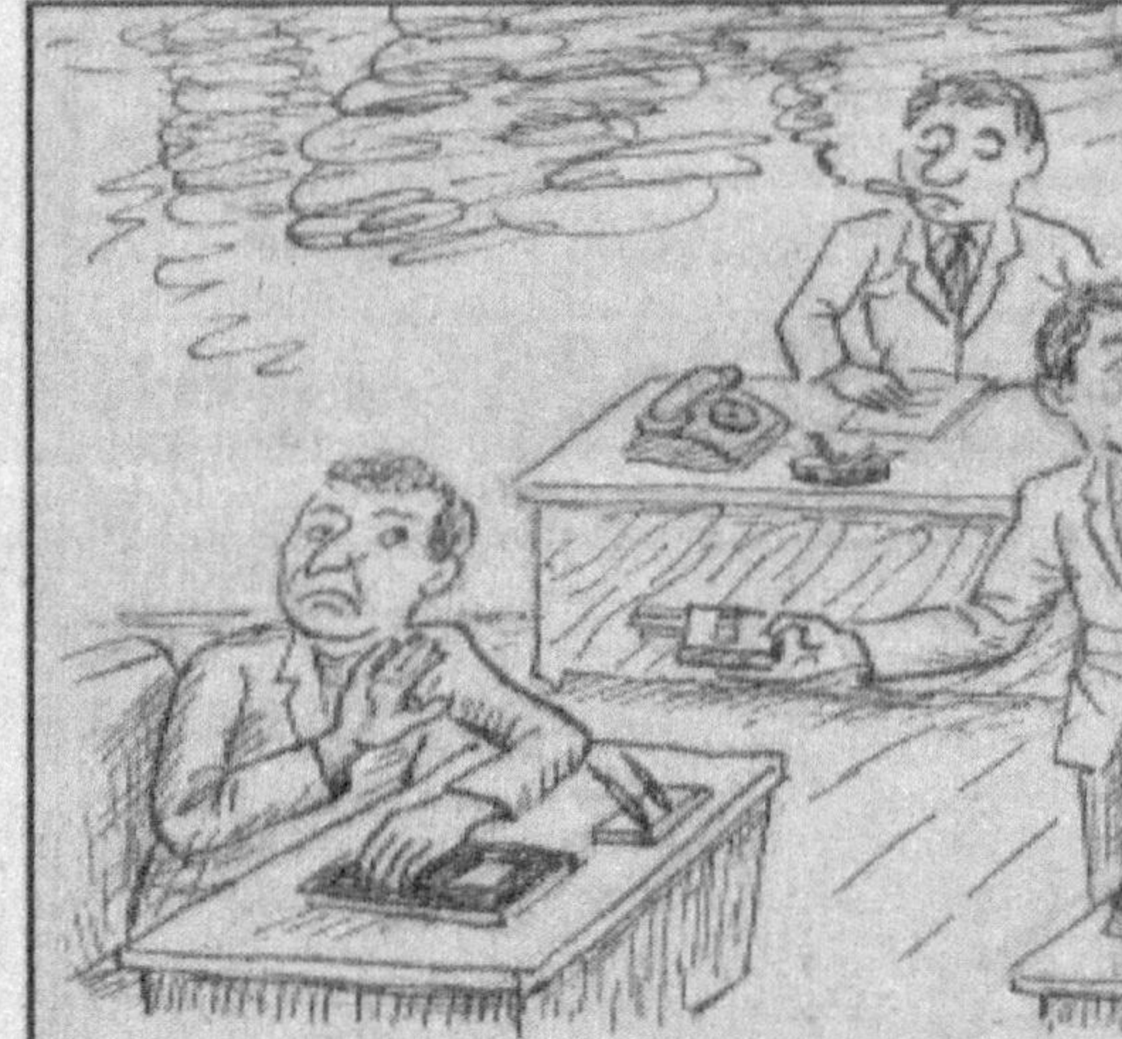
"XON"нинг тутунини ҳам шубҳасиз бизникидир!

Хулоса қилиб айтганда, мақола ёзилган ва топ этилган кезларда университетдаги ўқув-тарбия ишлари миллий заминдан узилмаган ҳолда олиб борилса, дейиш бир давлат, бир орзу эди, холос. Эндиликда орзу ушладди, асрий орзу Президент Фармони билан ўқтирилди! Ушбу Фармонни ўқиб асносида қалбимиз ва руҳимизда шундай бир ажиб қониқиш ҳосил бўлдики, кегаги орзунинг бугун ушалиб турса, бундан ортиқ инсоний бахт борми ўзи дунёда!