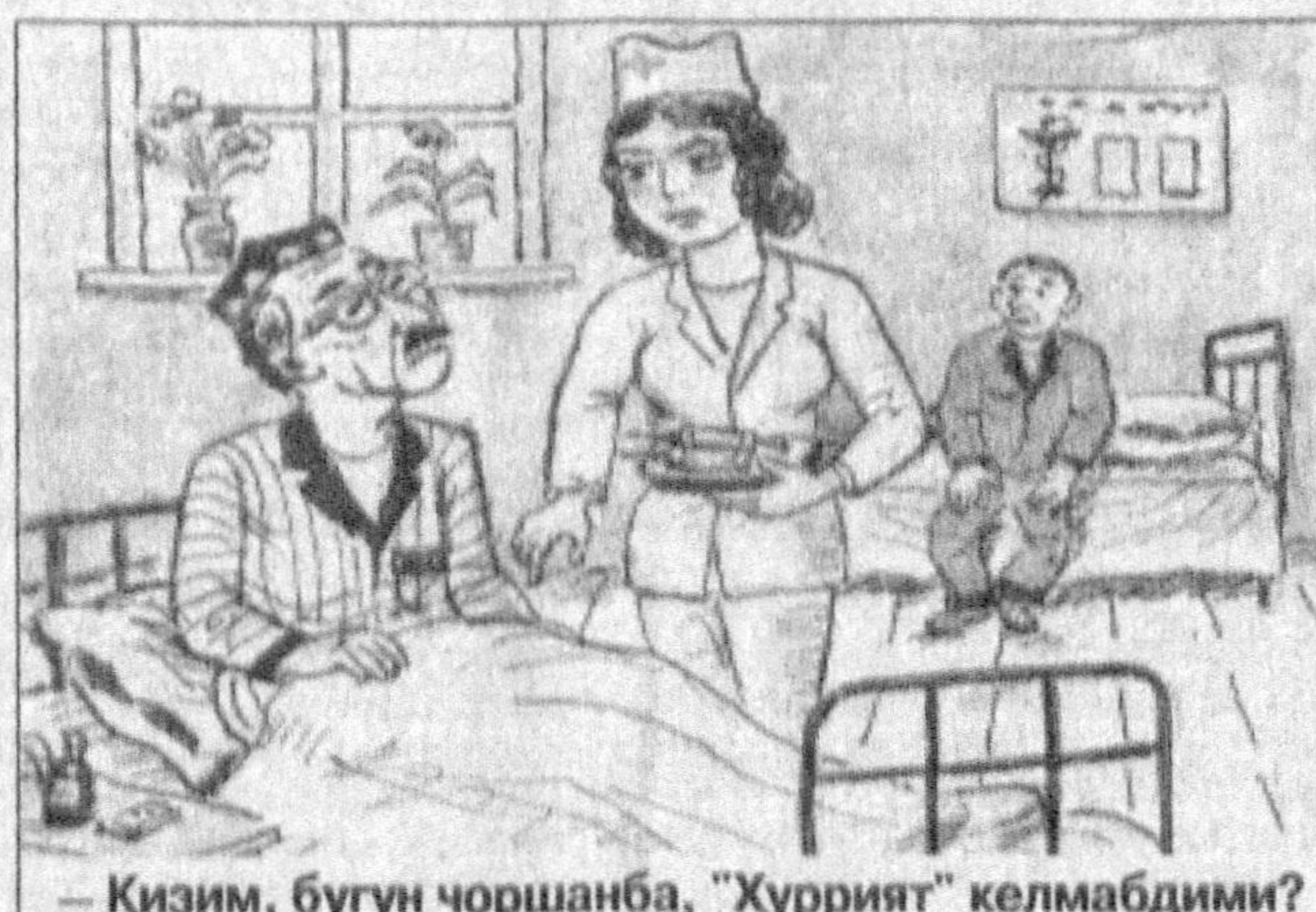
— Кизим, бугун чоршанба, “Хуррият” келмабдимми?