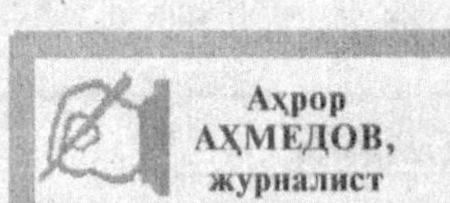
Ахбор АҲМЕДОВ, журналист

Иккинчи йўл, назаримда, бир қадар мушкулроқ ва айнан шу бугундан конкрет ишлар, ҳаракатлар, ҳаттоки маблаглар талаб этади. Назаримда, кўпчилик мафкурани, маънавиятни фақат даъватлар, қаҳриқлар билан барпо этиш мумкин деб ўйлайди чоғи. Ишни мактабга-ча тарбия муассасалари, мактабларнинг моддий-техника базасини янада яхшилаш, у ерда ишловчиларнинг шароитларини яхшилаш қайғуришдан бошлаш лозим. Адабиётлар, дарслиқлар, ўқув қўлланмаларнинг сифати, савияси қатори нархи тўғрисида ҳам ўйлаб кўриш керак. Бир неча фарзанди лотин имло-сидига дастурда ўқийтса-да, уйда бирорта лотин имло-сидига қўшимча адабиёт йўқ оиналар бор. Шундайларнинг биттаси "Дарсликка зўрға пул топдим-