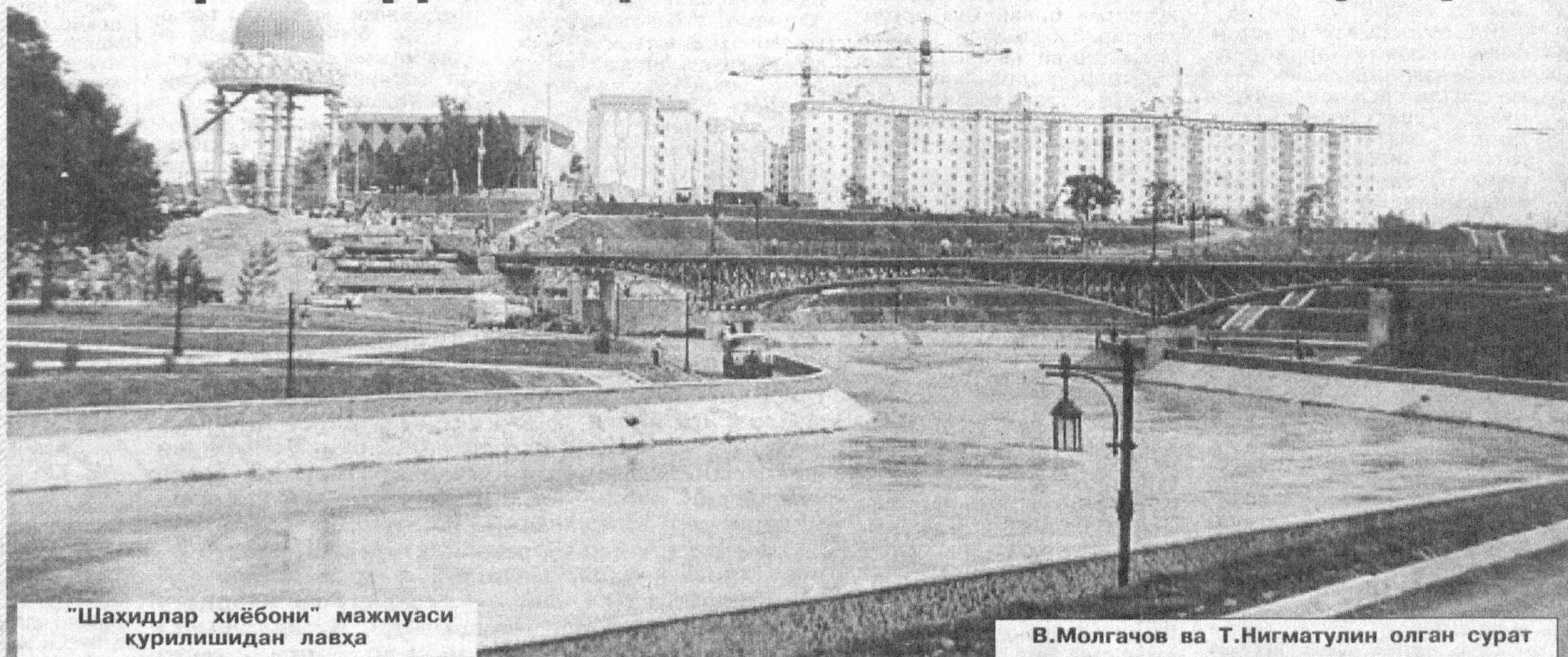
"Шахидлар хибони" мажмуаси қурилишидан лавҳа

Мамлакатимизда 59300 нафар Иккинчи жаҳон уруши иштирокчиси, 250000дан ортиқ фронт ортида меҳнат қилган фахрийлар барҳаёт!