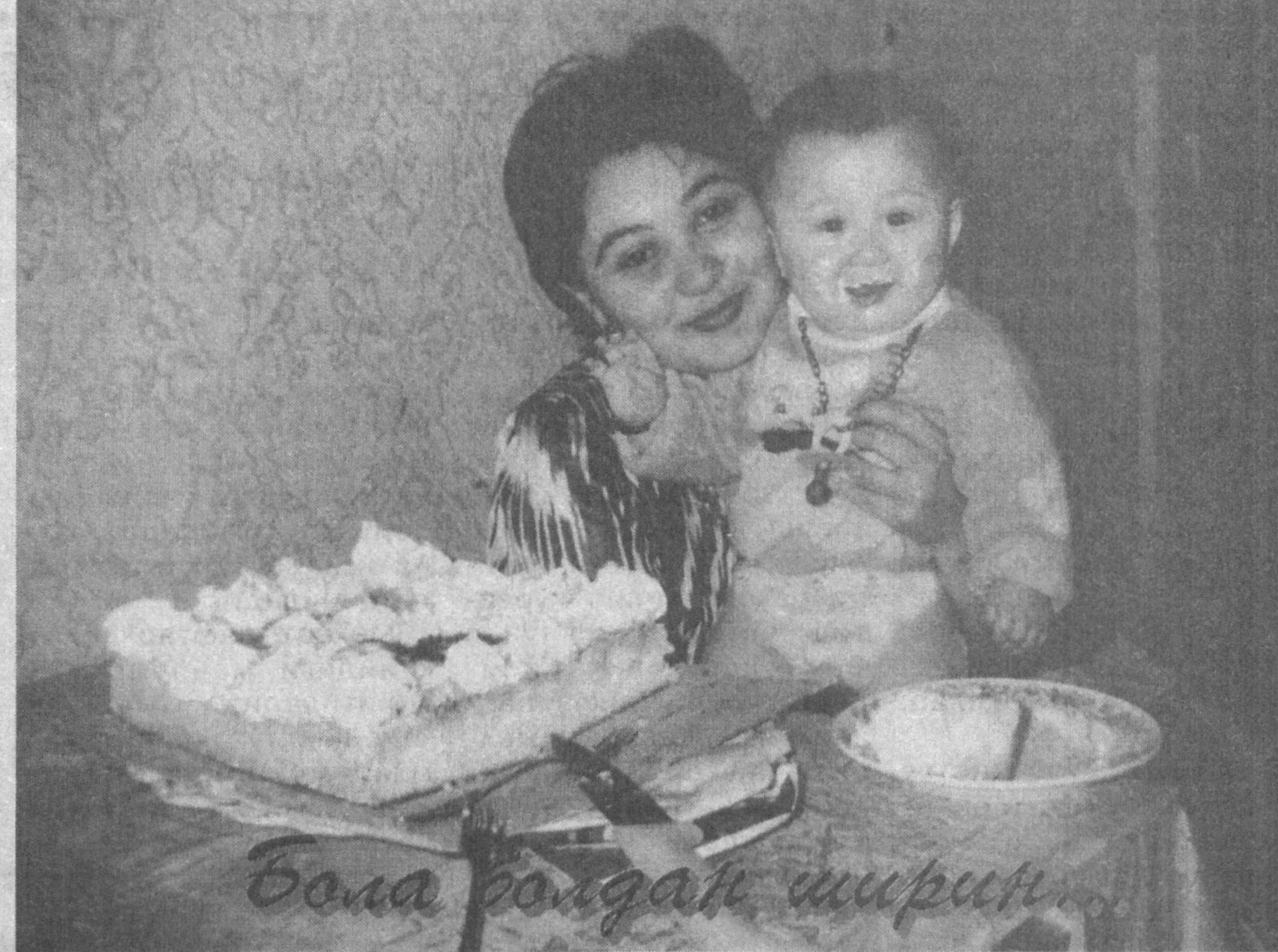
Бола бондан ширин...

Вазирлик йўли билан янги китоб-альбом ҳам босмага тайёрланмоқда. «Истиклолнинг улуг қадамлари» деган номидаги мазкур нашр ўзбек, инглиз ва араб тилларида китобхонларга тақдим этилади. Бу ишда Тошкент Ислоҳ университети олимлари фаоллик кўрсатишади. Бундан ташқари, «Ўзбекистон ифтихори» деган китобнинг янги тўлдирилган наشري ҳам босиб чиқарилади.