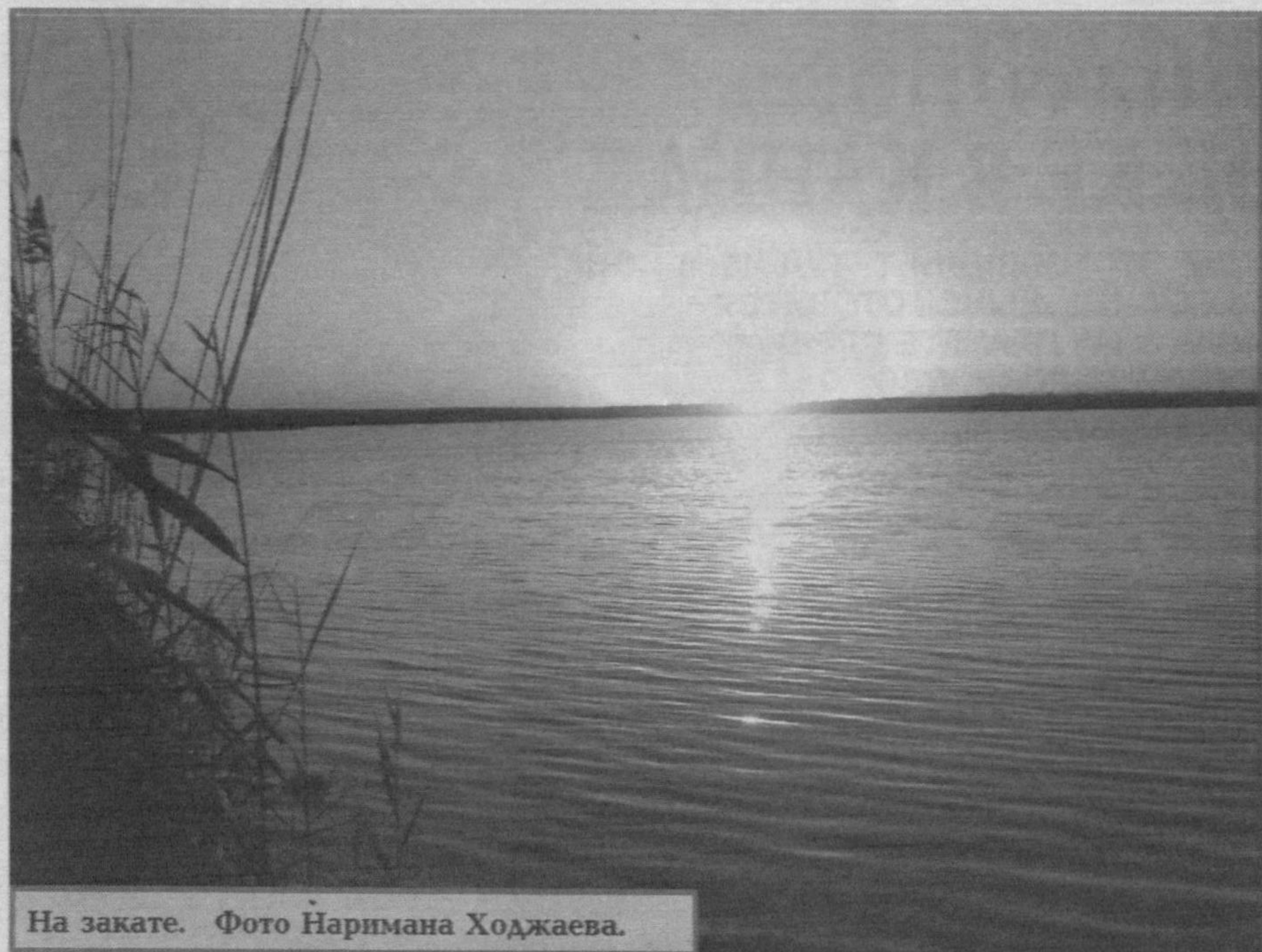
На закате.

СП «КрокусГазСервис», являясь официальным представителем ЗАО «Газдевайс» (Россия, Москва) и ЭПО «Сигнал» (Россия) на территории Узбекистана,