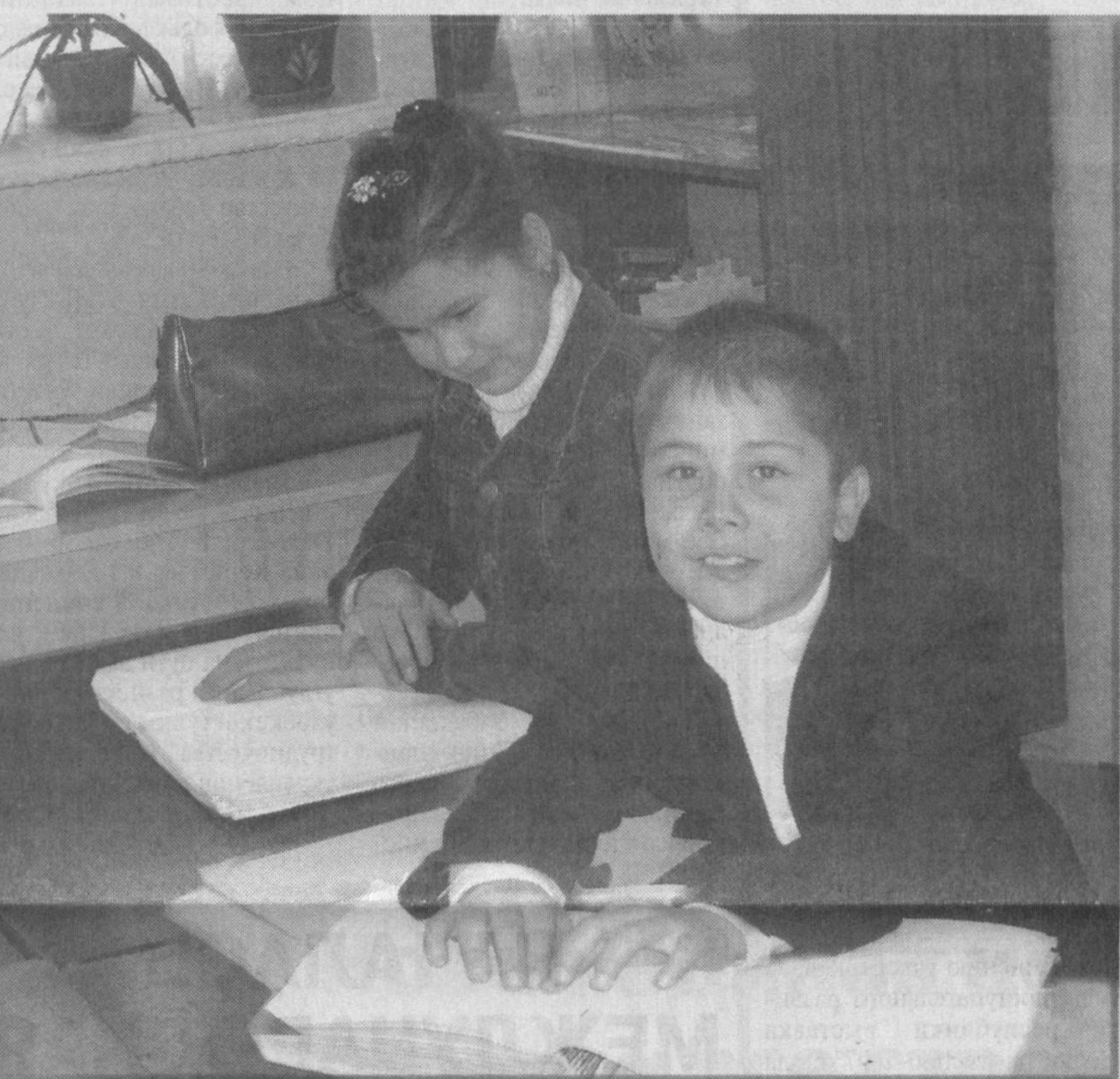
На фото: дети с нарушениями слуха и зрения в школе-интернате.

Хотя сейчас парк машин фермерского хозяйства ежегодно пополняется, отношение к этому трактору у Гульнары особое: и отремонтирует вовремя, и покрасит, да и старается не перегружать. Срок эксплуатации трактора давненько истек, но он и сегодня готов к работе. (Окончание на 2-й стр.)