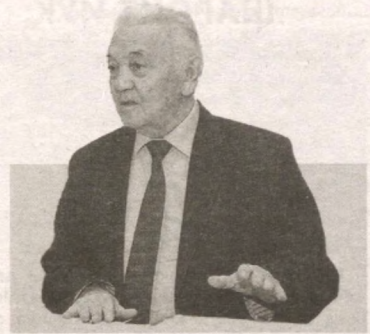
Убайдулла МИНГБОВЕВ, Ўзбекистон Республикаси Судьялар олий кенгаши раиси, Ўзбекистонда хизмат кўрсатган юрист

Хулоса қилиб айтганда, бу йилги Мурожаатнома янги Ўзбекистонни, юрти-