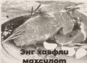
Энг хавфли маҳсулот

Маълумки, технологиялар асрида техникага бўлган талаб ҳам ортади. Уяли телефонлардан узоқ вақт фойдаланганимизда уларнинг қуввати тезда тугаб қолади. Оқибатда, уларни қувватга тўйинтириш учун 2 ёки 3 соат вақт кетади. Бироқ Ойша Кхарегнинг ўйлаб топган усулида бундай мобил телефонларни 20-30 сонияда қувватга тўлдириш мумкинлиги кўпчиликини ҳайрон қолдирди. Ихтирочи омма эътиборига ана шундай юқори ва тезкор зарядлашда хизмат қиладиган миттигина электр тўллайдиган нанобатареякани тақдим этди. Бу мослама келажакда уяли телефон, планшет ва ноутбукларнинг ишлаб чиқариш тизимини ҳам ўзгартириши турган гап.