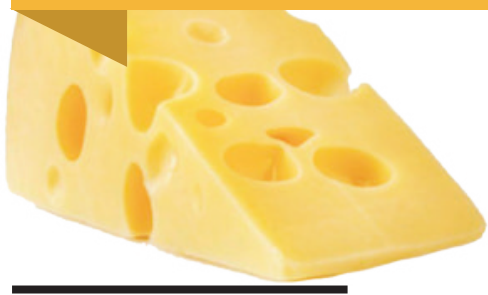
Ирода ТОШМАТОВА, "Янги Ўзбекистон" мухбири