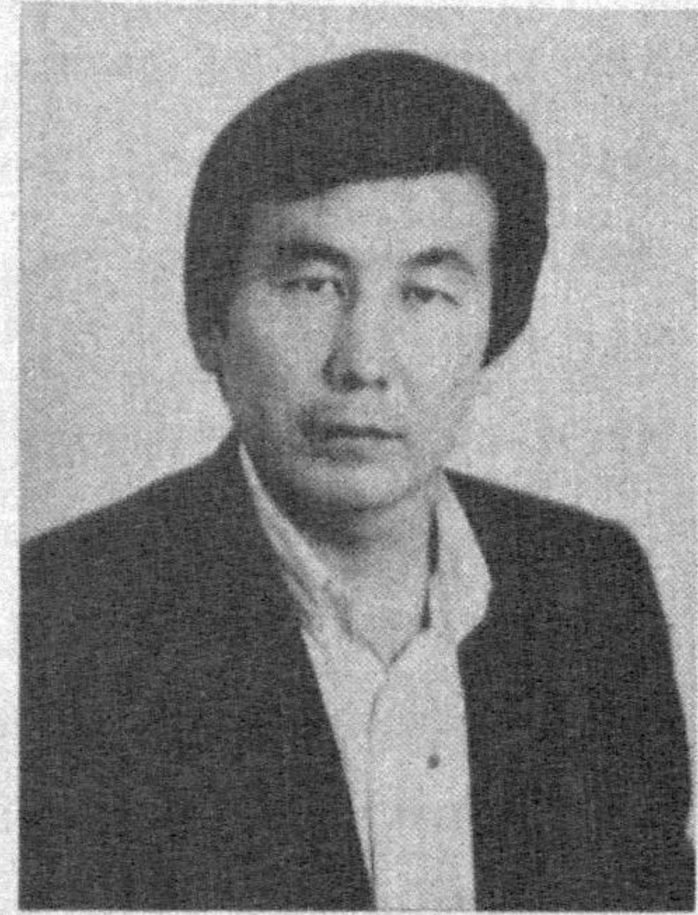
Шайх Муҳаммад Содиқ Муҳаммад Юсуф

«Бир ишқ ҳам чин бир ишқ» Отабек ҳам, Кумуш ҳам айна бир дақиқада ишқ дарида мубтало бўлади.