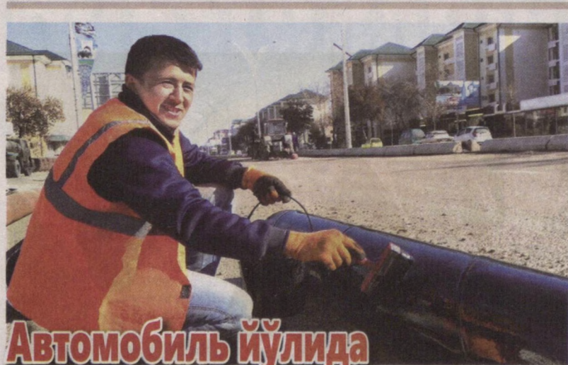
Автомобиль йўлида велосипед йўлаги ҳам бўлади

Бухоро шаҳридаги 4P91д (А380 автойўлидан Бухоро аэропорти йўналиши) автомобиль йўлининг 3 километр қисмида таъмирлаш ишлари олиб борилмоқда.