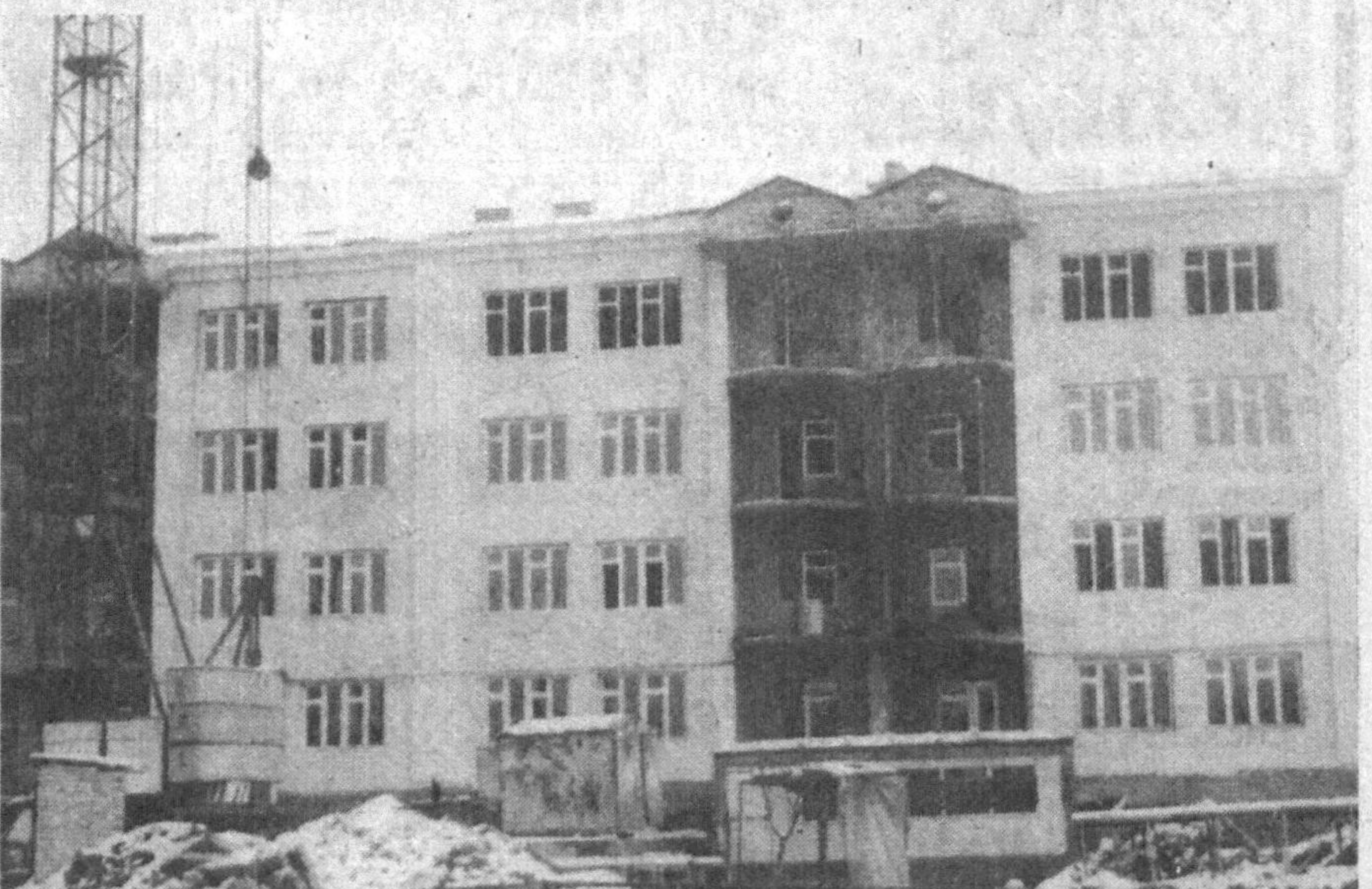
Шаҳар Ҳамза туманида қад ростлаган турар-жой биноси.