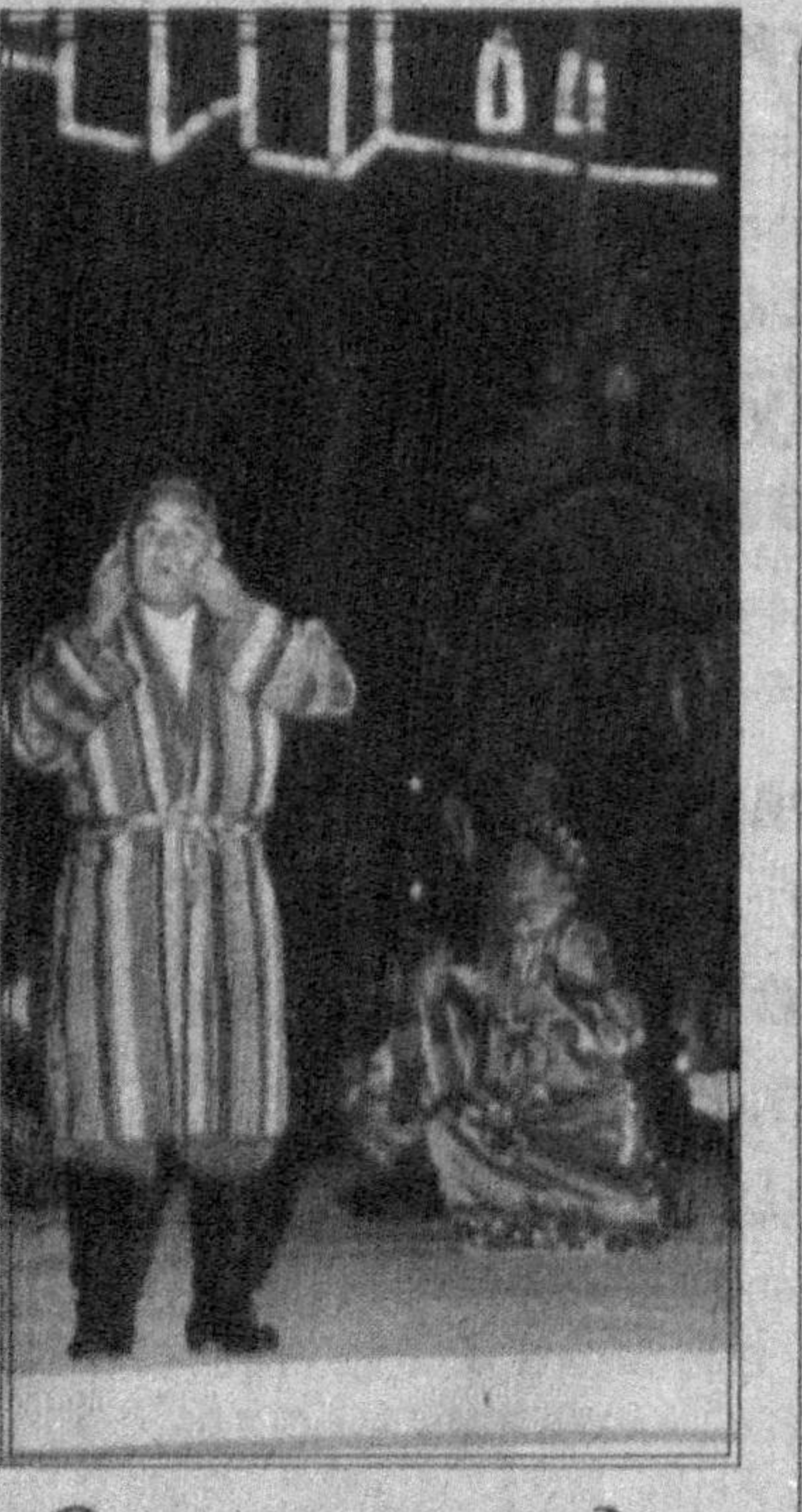
Олис-олислардан бир наво келур

кўтарилиш мумкин. Бу дарахт бундан 100 йил муқаддам, яъни 1868 йили кучли бўрон таъсиридан ағдарилиб тушган. Айни вақтда Канар оролларида (Икода ва Ла-Лагунеда) аждар дарахтининг 2 минг ёшга кирганлари мавжуд. Шу ўринда Ўзбекистонда ҳам умрбоқий дарахтлар борми, деган табиий савол туғилади. Ўзбекистонда, хусусан, Марказий Осиёда ҳам узок умр кўрувчи дарахтлар бор. Масалан, чинор, Буюк бобомиз Амир Те-мур Самарқандда ўн тўртта боғ барпо қил-дирган, улардан битта-сига асосан чинор эк-дирган, у «Боги Чинор» деб аталган. Республика-мизда асрлар оша кўпгина тарихий воқеа-ларнинг гувоҳи бўлиб