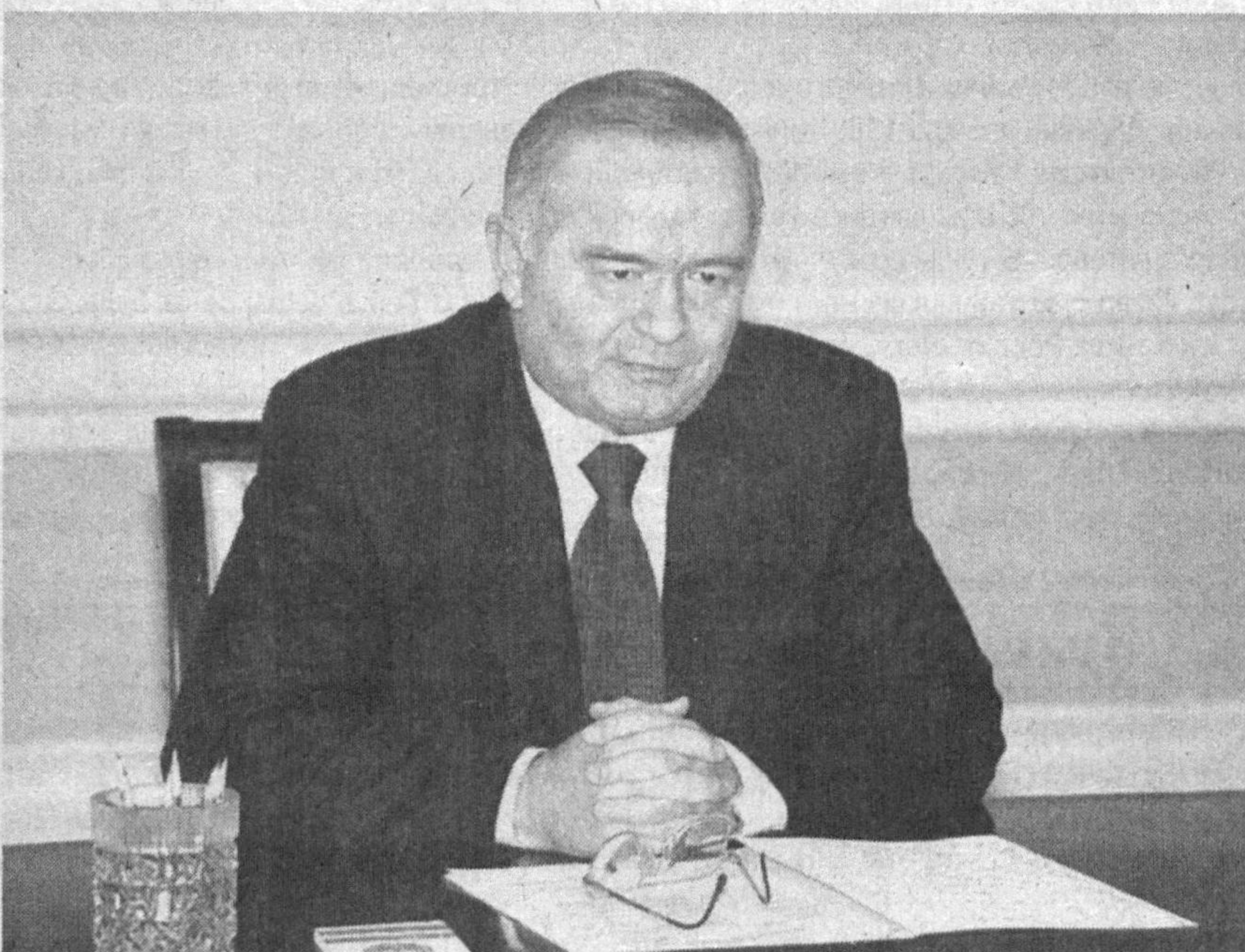
Ўзбекистон Республикаси Президенти Ислам Каримов 17 январ кун Оқсаройда Томас Дэйл раҳбарлигидаги бир гуруҳ АҚШ сенаторларини қабул қилди.

Биз АҚШдаги воқеаларни, Ҳақиқатан ҳам, сентябр жоже-халқаро аксилтеррор операцияси-асидан кейин АҚШ халқи янада сини диққат билан кузатиб бормоқдамиз. 11 сентябр кун руй берган муҳдиш воқеадан кейин жуда катта ҳодисанинг гувоҳи бўлдик. Америкаликларнинг иро-даси ҳаммага ўрнатилди, - деди Ислам Каримов учрашувда.