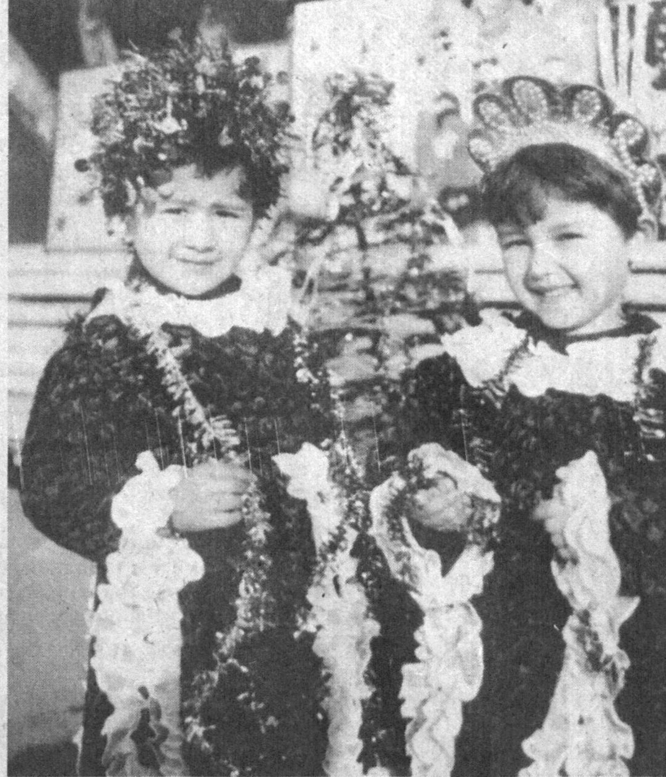
Суратларда: богчадаги Янги йил эрталигидан лавҳалар.