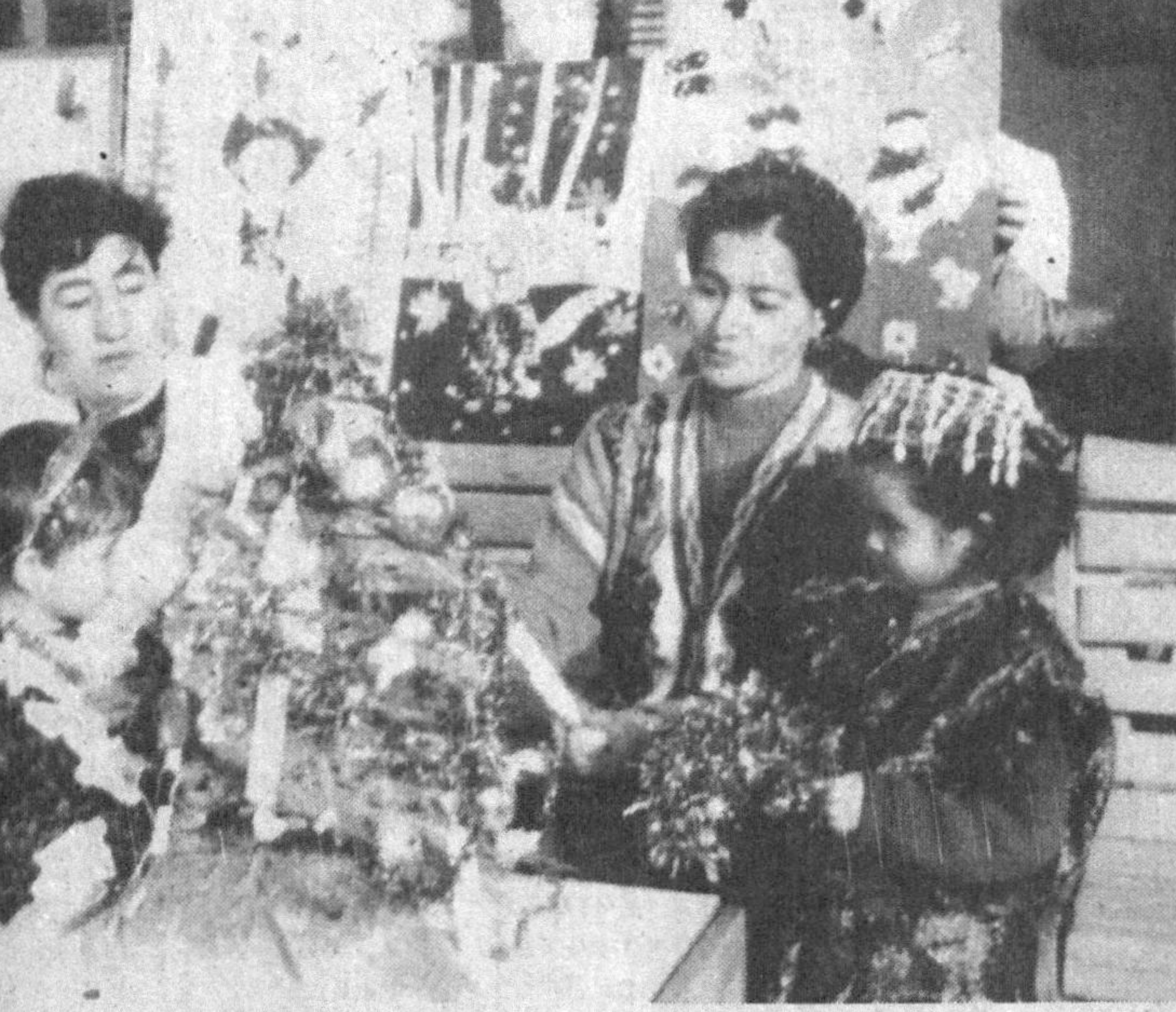
Ўлкамизда Янги йил тантаналари давом этмоқда. Гузур туманидаги «Олмагон» болалар богчасида ҳам бугун ўзгача кайфият ҳукм сурмоқда. 140 нафар кичкинтой тарбияланаётган ушбу богча жамоаси турли эртак қаҳрамонларини акс эттирувчи ли-