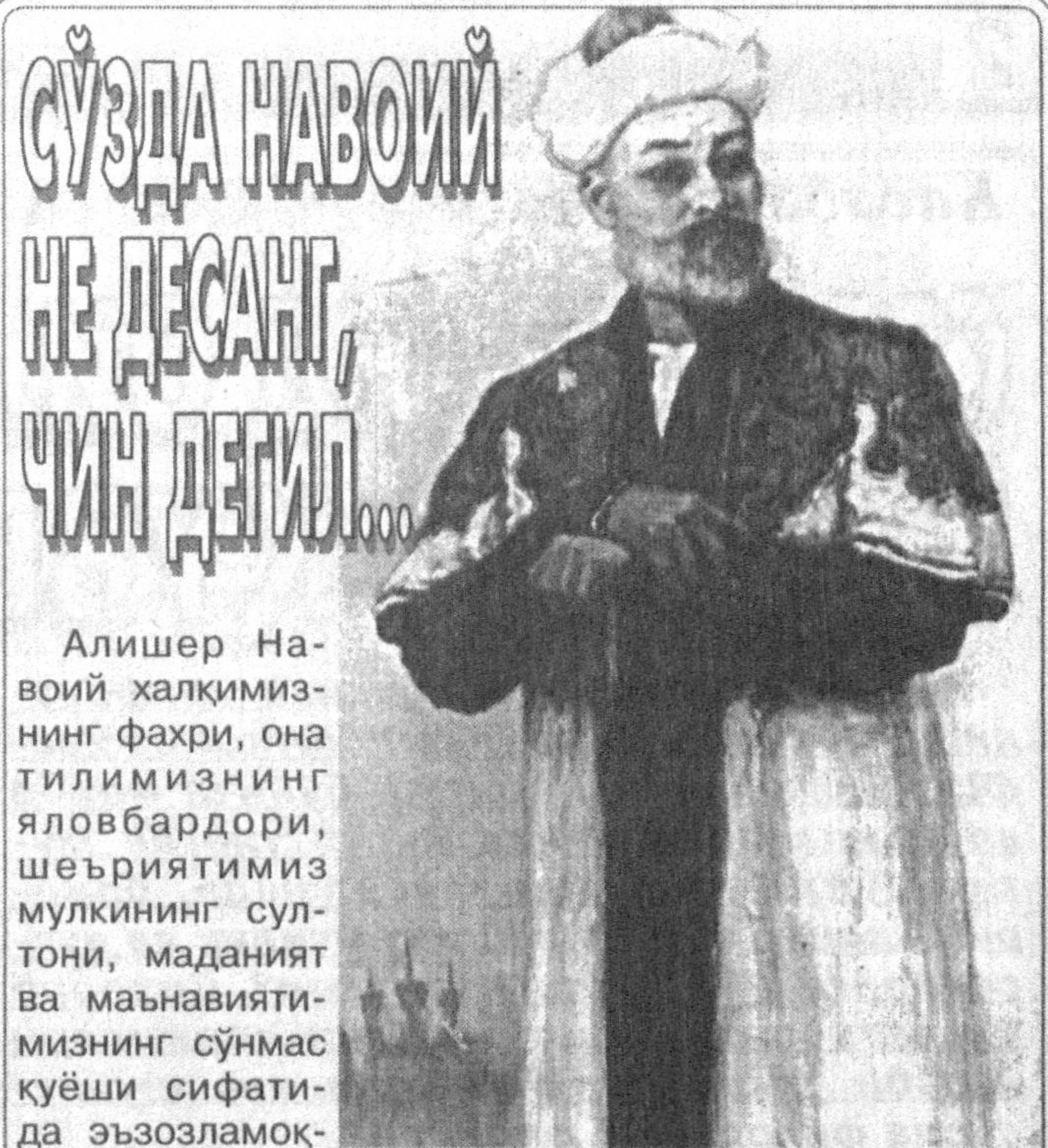
Сўзда Навоий НЕ ДЕСАНГ, ЧУН ДЕГИЛ...

Энди Олимпиада ўйинларига келсак, бу нуфузли мусобақада ҳам бўш келмасликка, Ўзбекистон байроғини баланд қўтаришга ҳаракат қиламан.