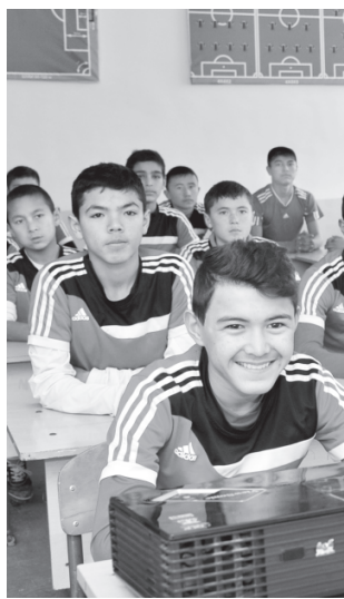
РЕКЛАМА ВА ЭЪЛОНЛАР

Ўтган қисқа даврда воҳалик ёшларнинг 300 дан зиёди жаҳон, Осиё ва мамлакат чемпиони, деган шарафли номга сазовор бўлгани ҳам бу соҳадаги ислохотлар юксак самара бераётганини яққол ифодалайди.