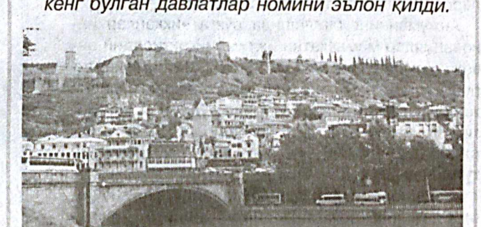
Унда дастлабки учта ўринни Чили, Жанубий Корея ва Португалия эгаллаган. Шунингдек, Жибутти, Янги Зеландия, Маврикий, Мальта, Хитой, Грузия ва Жанубий Африка Республикаси ўнтаклики яқунлаб берган.

Австралияда нашр этиладиган "Якка сайёра" ("Lonely Planet") номли журнал ўз талқини бўйича жаҳонда туризм имкониятлари кенг бўлган давлатлар номини эълон қилди.