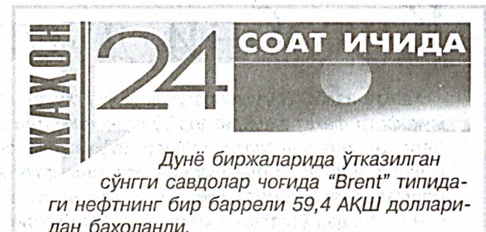
Дунё биржаларида ўтказилган сўнгги савдолар чоғида "Brent" типидagi нефтнинг бир баррели 59,4 АҚШ доллари-дан баҳоланди.