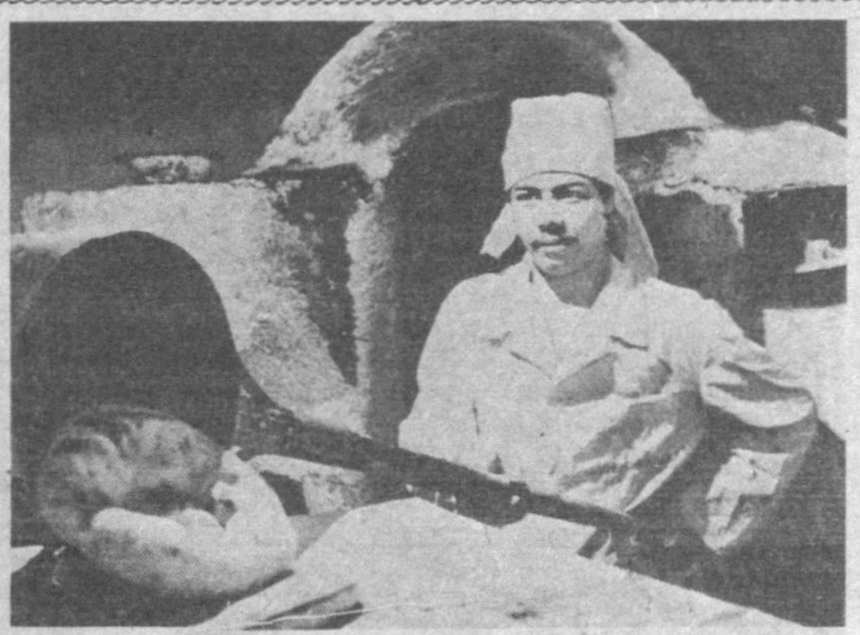
Иссиқ тандир нонини нонуштага тортиқ этишга нима етсин! Дастурхонимизни тўқни қилаётган қўли гул новвойларимизга ҳорманг энди, дегнимиз келади.