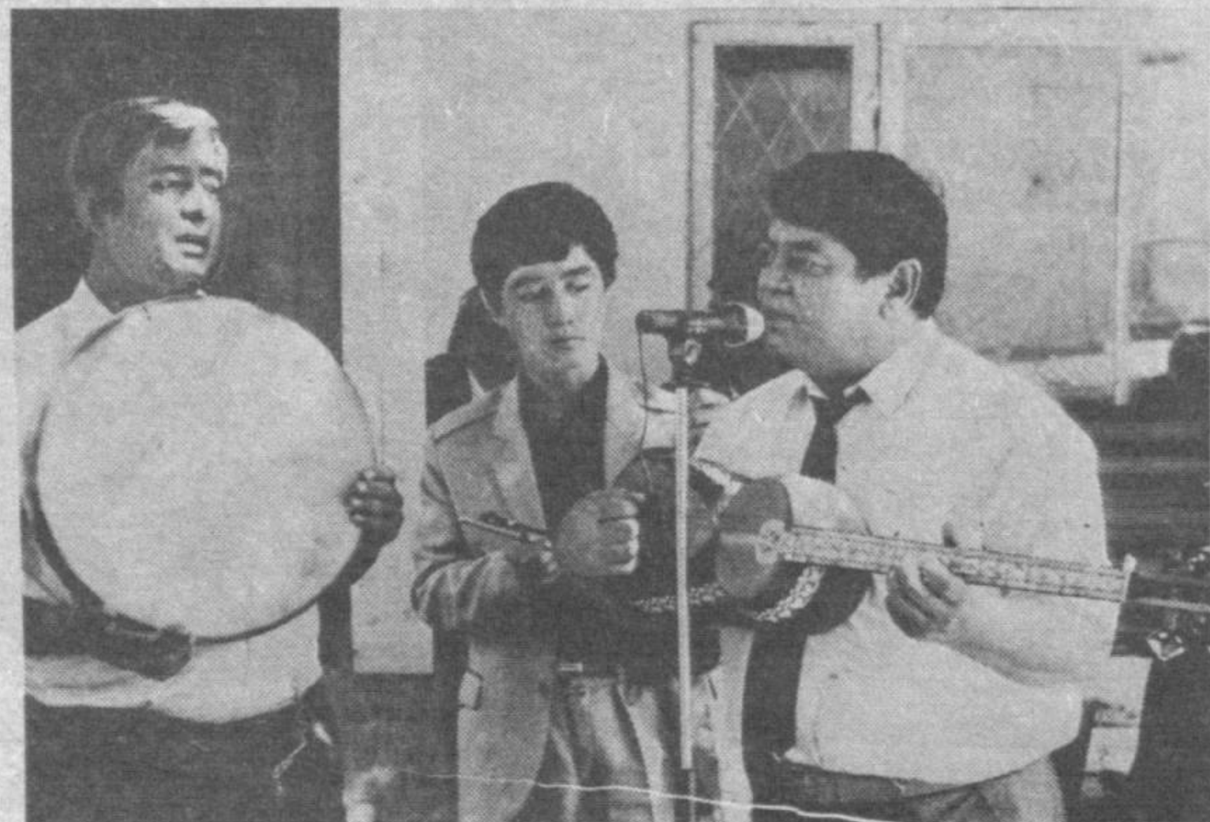
© СУРАТЛАРДА: маҳаллада ўтказилган тадбирдан лавҳалар. Даврон Аҳмедов суратлари.