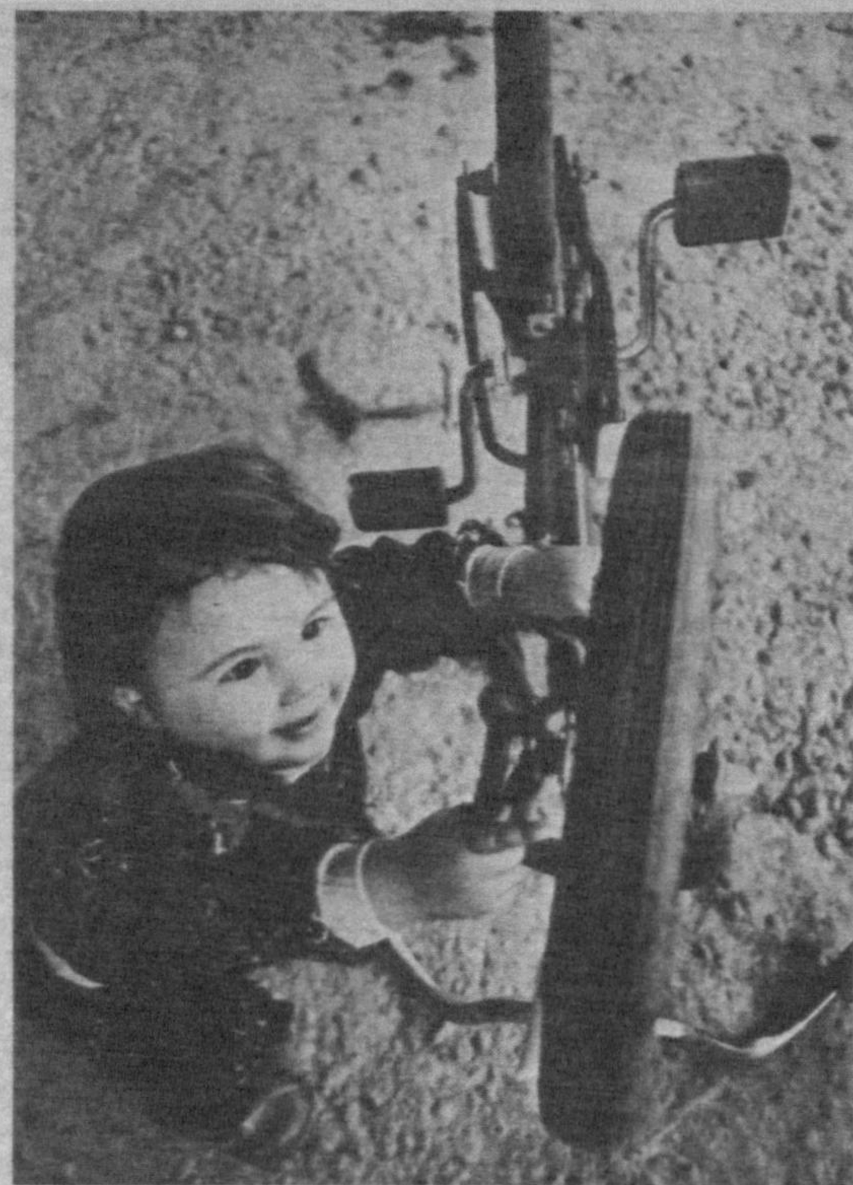
«Қани бир кўрайликчи!»