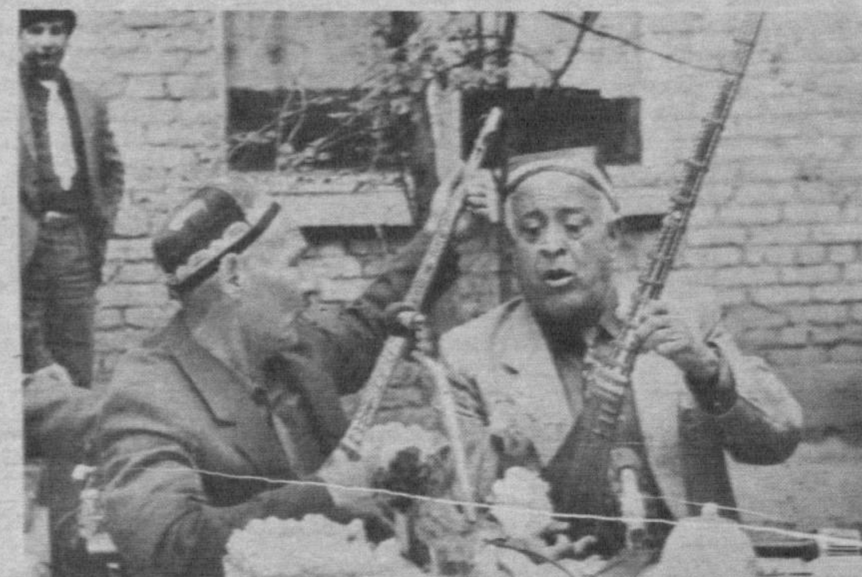
●СУРАТЛАРДА: маросимдан лавҳалар.