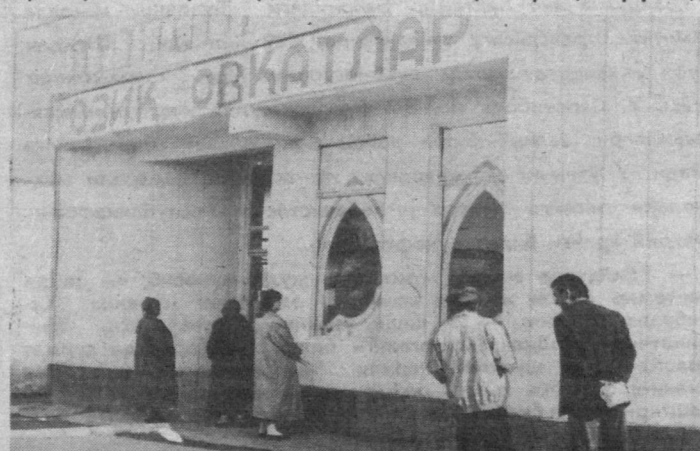
© Октябрь районининг «Камолон» маҳалласида очилган озиқ-овқат дўкони.

километр суғориш шохобчалари; Ленин районидagi 4,8 километр ташқи ёритгичлар тармоғи, 95,1 минг квадрат метр йўл ва йўлаклар, 2 километр суғориш шохобчалари; Октябрь районидagi 10,7 километр ташқи ёритгичлар тармоғи, 123,4 минг квадрат метр йўл ва йўлаклар, 10,2 километр суғориш шохобчалари; Собир Раҳимов районидagi 6,4 километр ташқи ёритгичлар тармоғи, 32,7 минг квадрат метр йўл ва йўлаклар, 7,8 километр суғориш шохобчалари; Сергели районидagi 6,7 километр ташқи ёритгичлар тармоғи, 39,5 минг квадрат метр йўл ва йўлаклар, 1,6 километр суғориш шохобчалари; Фрунзе районидagi 10,1 километр ташқи ёритгичлар тармоғи, 90 минг квадрат метр йўл ва йўлаклар, 5,3 километр суғориш шохобчалари; Хамза районидagi 9,4 километр ташқи ёритгичлар тармоғи, 82,2 минг квадрат метр йўл ва йўлаклар, 9,3 километр суғориш шохобчалари; Чилонзор районидagi 15,2 километр ташқи ёритгич тармоғи, 38,9 минг квадрат метр йўл ва йўлаклар, 0,8 километр суғориш шохобчалари тўла таъмирланди. Бу—шаҳар миқёсида жами 93 километр ташқи ёритгичлар тармоқлари, 714,1 минг квадрат метр йўл ва йўлаклар, 68,4 километр суғориш шохобчалари тўла таъмирланди демакдир. Бу мақсадлар учун 7970,6 минг сўм, яъни режадагидан 2107,6 минг сўм ортиқ сарфланди.