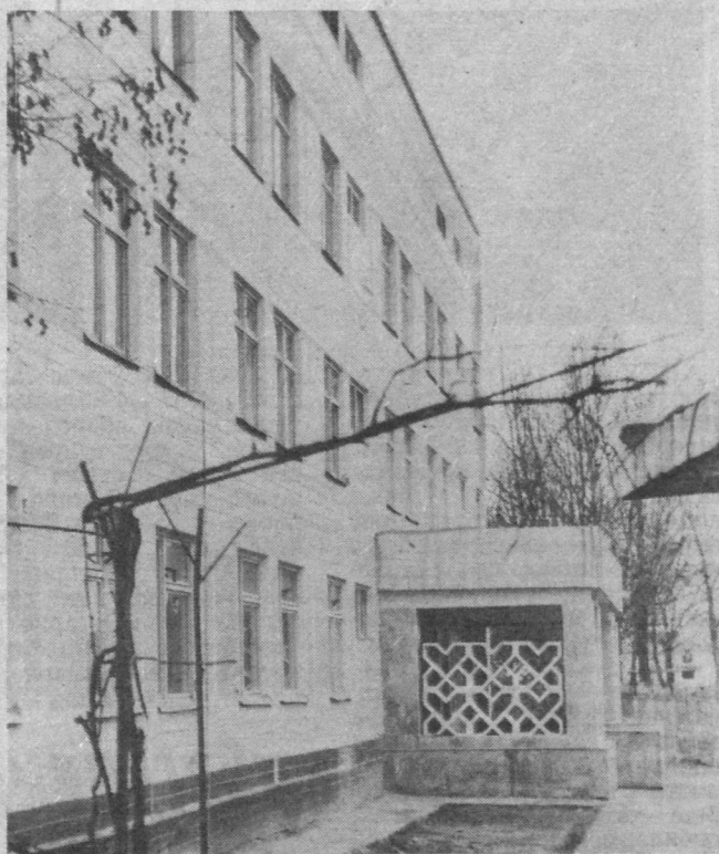
© Акмал Икромов районининг Зиё Санд кўчасида янги очилган поликлиникали шифохона мажмуи.

Акмал Икромов районидagi Собир Раҳимов, «Пахтакор», Киров районидagi Кисловодск, Октябрь районидagi «Наврўз», Сергели районидagi «Тўмарис», Хамза районидagi