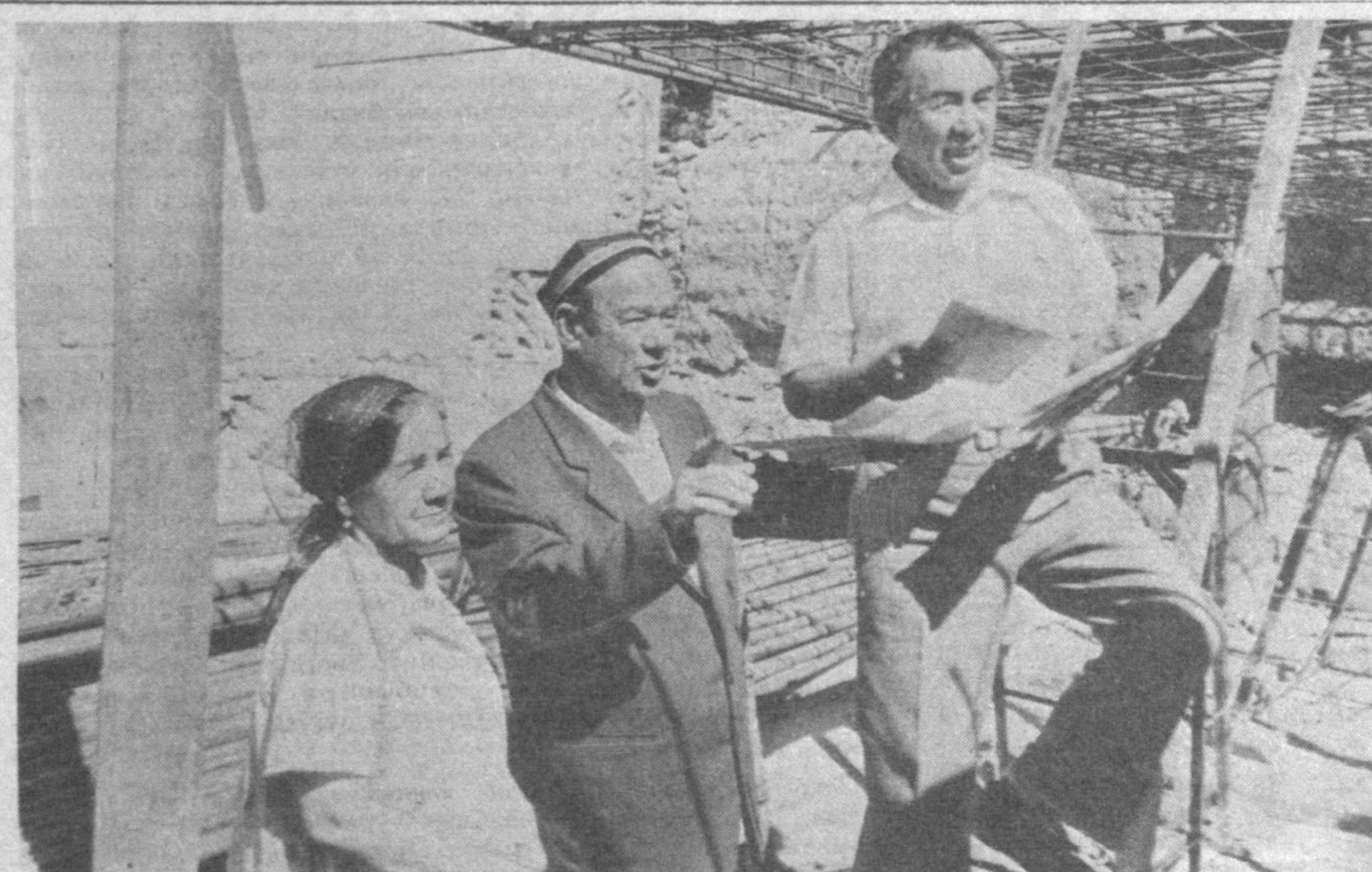
Бу киши — биздан