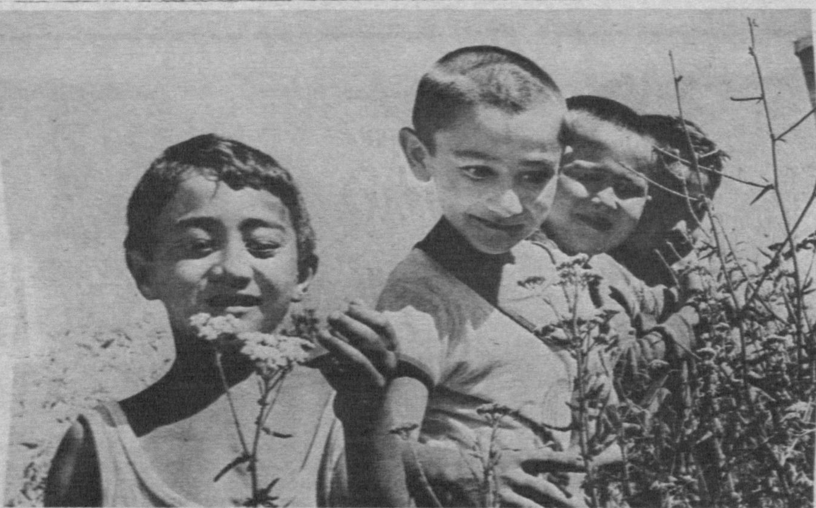
Уқувчиларнинг ёзги таътил мазмунли ўтмишда. Оромгоҳларда маҳаллалардан таъриф буюриб, кўнгилли ҳордиқ чиқарётган болаларни кўлаб учратиш мумкин.