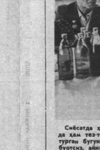
Сўбатда ҳам, иқтисодий-иқтисодий ҳаётда ҳам тез-тез турли ўзгаришлар бўлиб турган бугунги кунимизда ўзимизни матбуотсиз, айниқса, рўзномаларсиз тасавур қилиш қийин. СУРАТДА: отақонлар рўзномаларнинг янги сонларини мўталаб қилишмоқда.