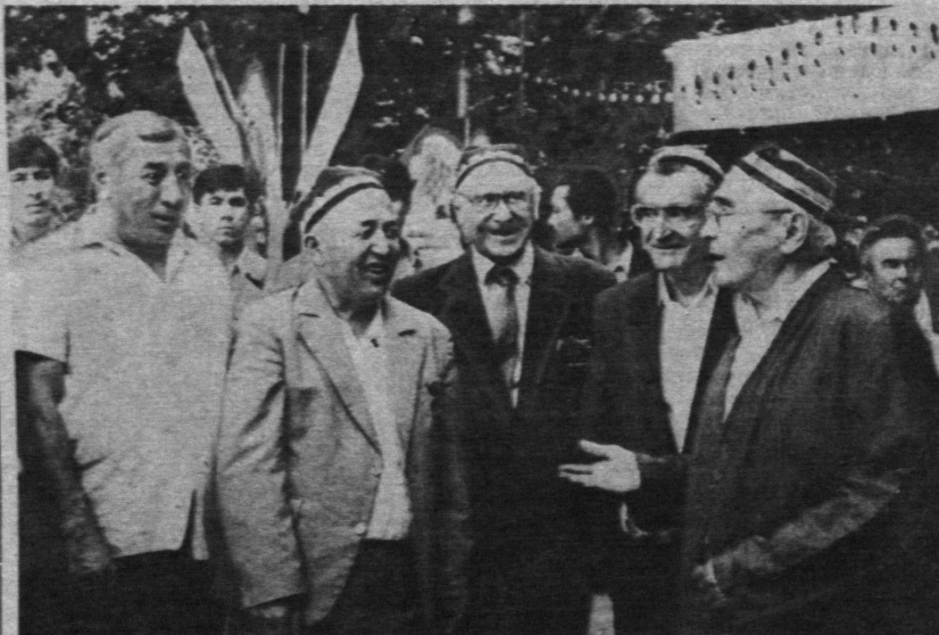
© Ақли дониш, кўпни кўрган, яхши фазаилатли бундай кишилар даврасиданги суҳбатлар ҳаммизга кўпгилларга ором ва завқ бағишлайди.

замонда жиноятчилик ҳам мескин ортиб борапти. Бунга кимлардир иқтисодий қашшоқликни сабаб деб билар. Аммо мен бунини ёшларимизнинг чойхоналардан, кутубхоналардан, эзгу удум бўлган тўйлардан узилиб қолаётганлигида, ёшлар ва нексалар ўртасида қандайдир кўзга кўринмас ровнинг олиб ташланмаганлигида деб ўйлайман. Хўш, нега дейишингиз табиий. Агар кейинги 10—15 йил ичиде ўтган, ўтаётган тўйларга, таъзия маросимларига, қироатхоналарга, чойхоналарга назар солган бўлсангиз, уларда ёшларни учратдингизми? Мен эса... учратолмадим ёки кам учратдим.