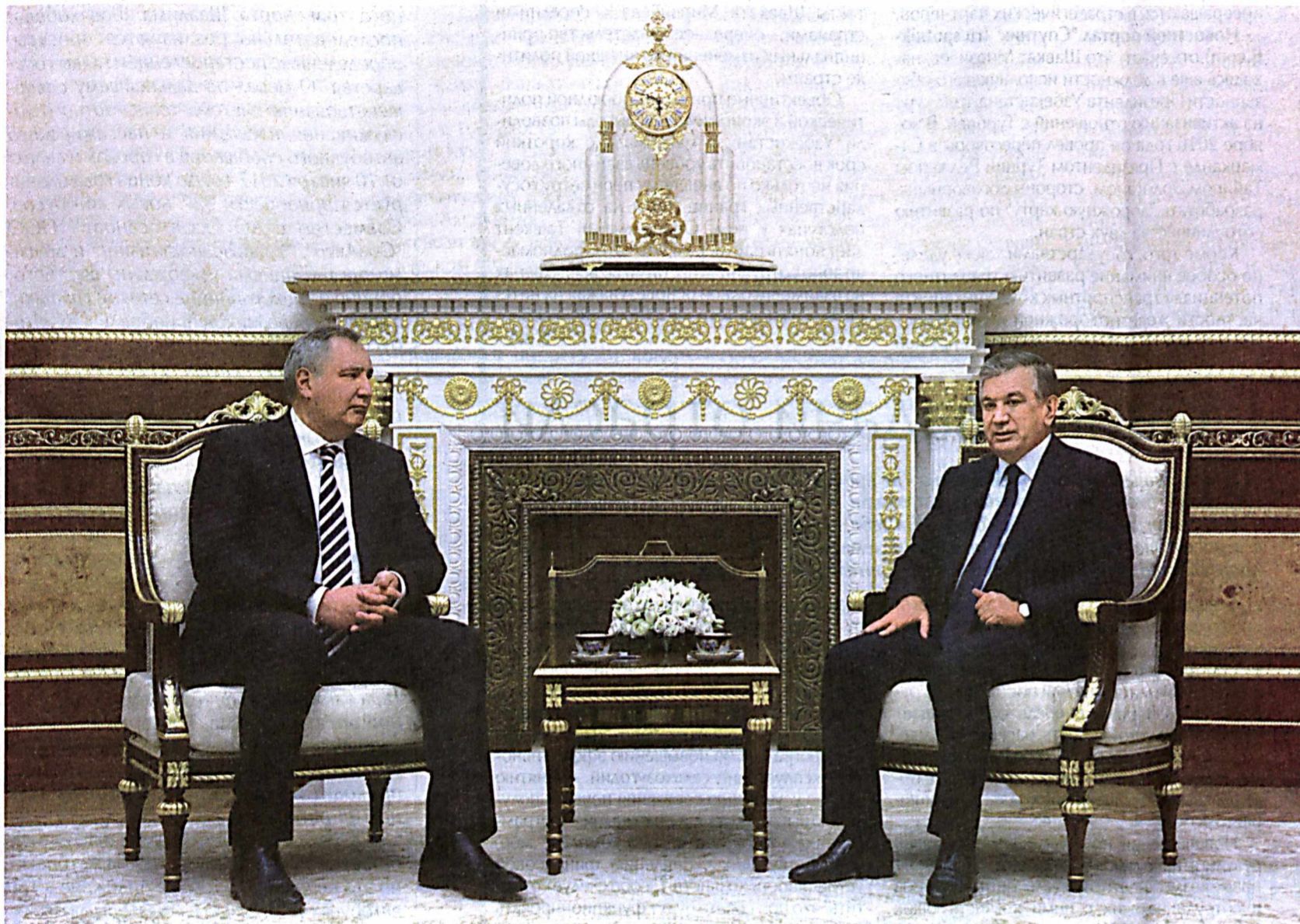
Президент Республики Узбекистан Шавкат Мирзиёев 27 октября принял заместителя Председателя правительства Российской Федерации Дмитрия Рогозина, прибывшего в нашу страну по поручению Президента Российской Федерации Владимира Путина.

Глава нашего государства, приветствуя гостя, с глубоким удовлетворением отметил, что регулярный и продуктивный диалог на высшем и высоком уровнях способствует укреплению узбекско-российских отношений стратегического партнерства и