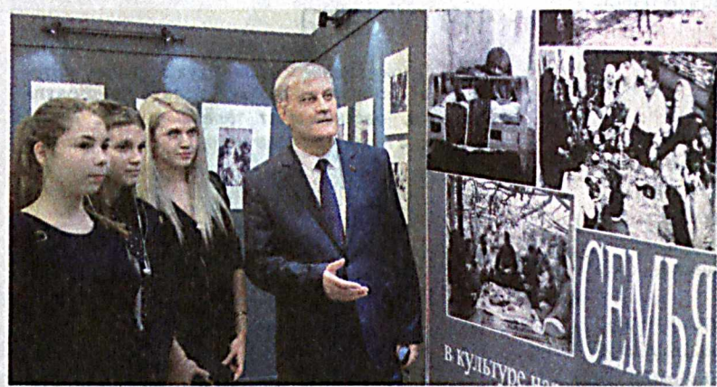
В Ташкентском Доме фотографии состоялось открытие фотовыставки Российского этнографического музея "Семья в культуре Евразии. XX век".

Каждый народ интересен и неповторим, - именно с таким посылом выступает экспозиция РЭМ, который является одним из наиболее значимых этнографических музеев мира, имея в своей коллекции более полумиллиона экспонатов.