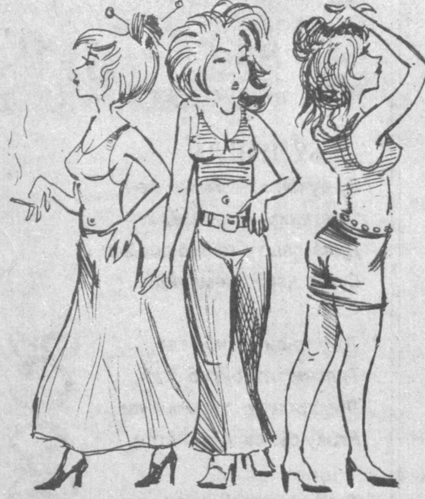
Борар жойимизнинг лекин йўқ фарқи Аёллар шим кийган ҳалқоб йилларда.

Айланиб турибди ҳаётнинг чархи, Бугун ўзгачадир ҳар қадам нархи,