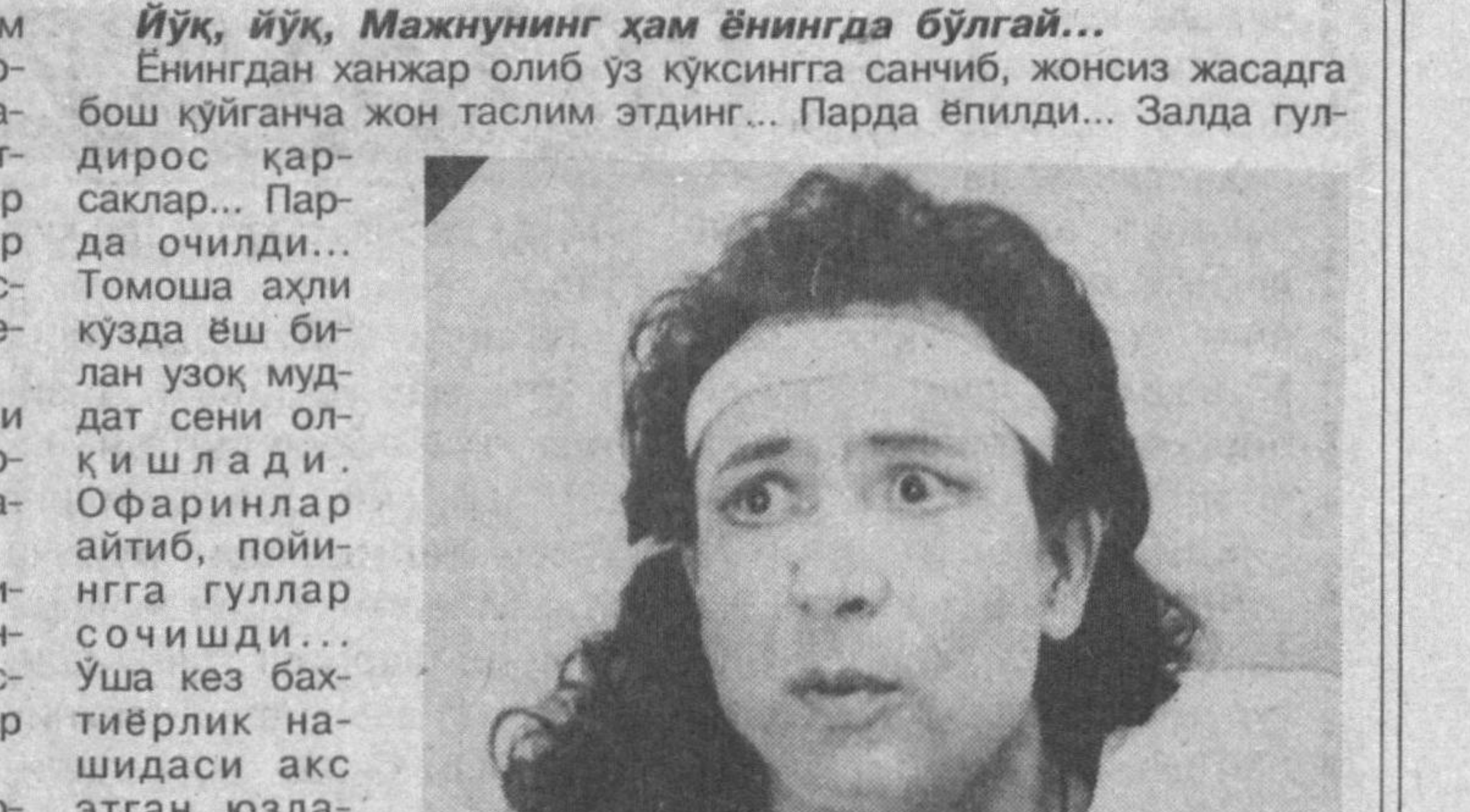
Йўқ, йўқ, Мажнунинг ҳам ўнингдә бўлғай...

Қаҳрамон! Фидойи, заҳматқаш актёр достим! Қулимга қалам олдим ўшиим уртасида анча фарқ борлиғига қарамай, бирбиримиз билан яқин дўст бўлиб қолганимиз ҳақида уйдалик. Сўҳбатларимиздан бирди «ҳали мен ўз қўшиғимни айтганим йўқ» деган сўзларингиз эсладим. Буюк актёрлар Шуқур Бурҳонов, Олим Хўжаев, Сора Эшонтураева, Наби Раҳимовлар иштирок қилган асарларда каттаю кичик роллар ижро этиб, ўстозларнинг меҳрини қозонган актёрнинг бундай қамтарлиғи мени ҳушуд этди.