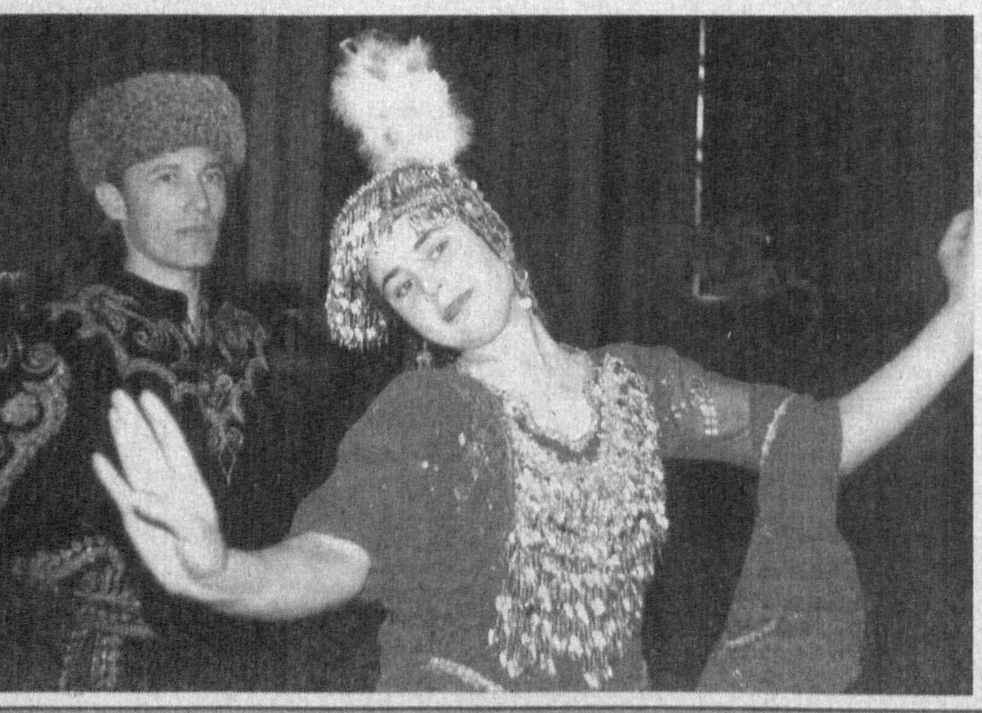
Икром ҲАСАНОВ олган суратлар.

Наврўз тантаналарини куй-қўшиқсиз, дилрабо рақсларсиз тасаввур этиб бўлмайди. Айни кунда эса Халқлар дўстлиги саройида вилоятлардан ташриф буюрган соҳанда ва хонандалар иштирокида Наврўз тантаналарига бағишланган концерт программаларига тайёргарлик кўрилмоқда. Санъаткорларнинг мақсади бу йилги байрамни янада жозибали ва чиройли ўтказишда ўз ҳиссаларини қўшишдир. Икром ҲАСАНОВ олган суратлар.