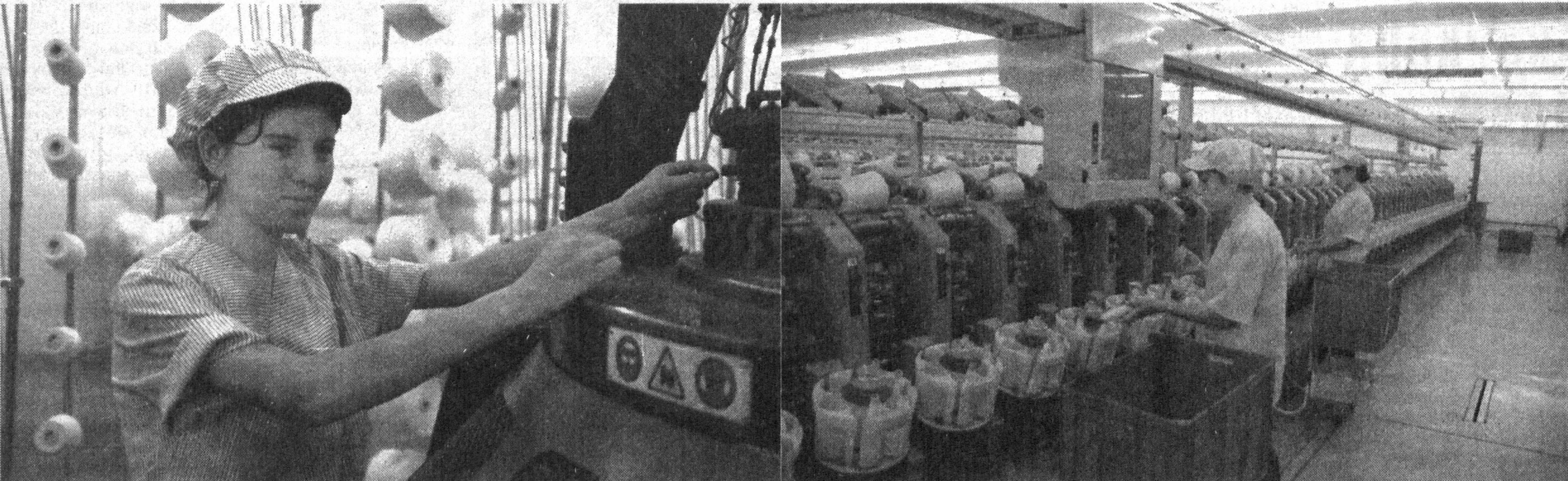
Суратларда: корхона фаолиятдан лавжалар.

СЕШАНБА, ЧОРШАНБА, ЖУМА ВА ШАНБА КУНЛАРИ ЧИҚАДИ