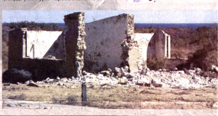
Есимхон ҚАНОАТОВ, «ISHONCH»

Устюртдаги собиқ полигон Нукусдан 400 километр олисда жойлашган бўлиб, ҳозирда унинг ўрни харобага айланган.