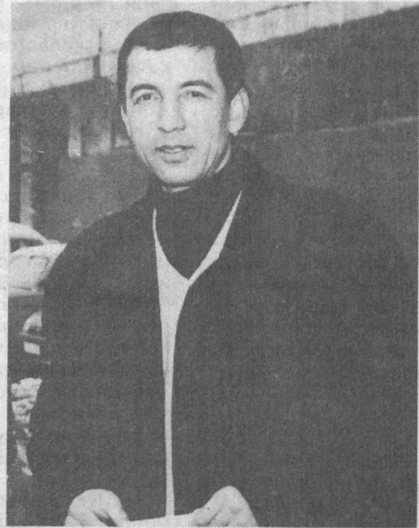
Мўлтирайдди бечора Усмон Носир, Чўлпон кўрмас кўкдаги чўлпонларни. Барчалари зиндондан чиқиб охир Банд этмишлар шу тигиз жавонларни.

Муълано деб сўйласалар-да, ҳамон Мақомгина бўлиб яшар Муқамил.