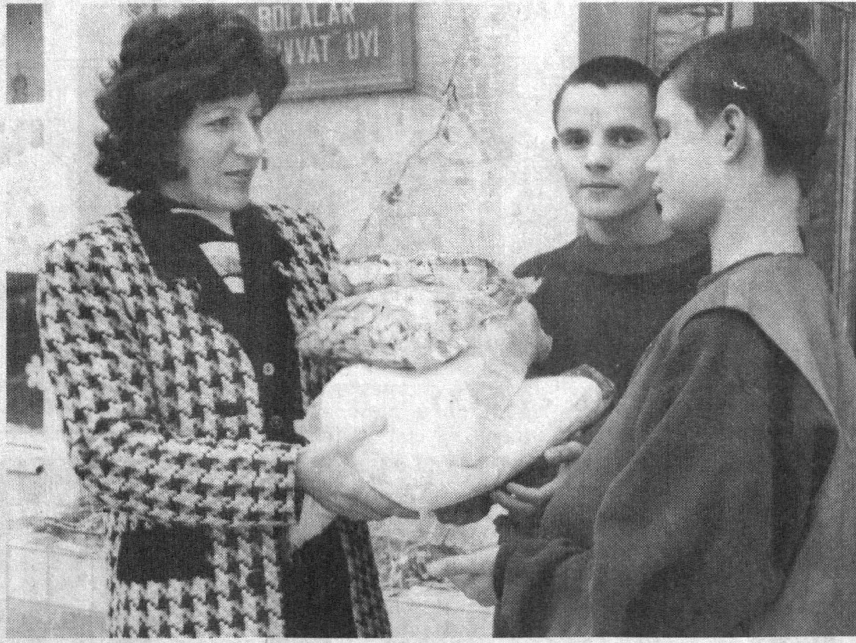
Меҳр-саховат айёми - Наврўз тантаналари нишонланаётган шу кунларда касабга уюшмалари ногирон ва кекса фуқароларимизга моддий-маънавий жиҳатдан қўмақ кўрсатишмоқда. Ўзбекистон энгил, меҳал сааноати ва коммунал-машиий хизмат кўрсатиш ходимлари касабга уюш-