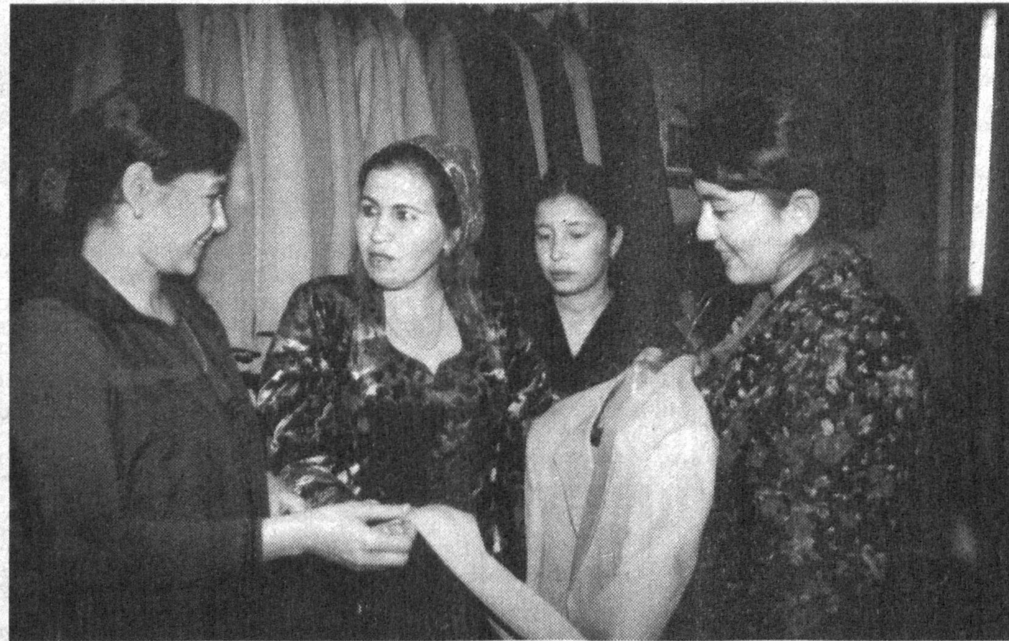
Бухоро шаҳридаги «ОФС» тивувчилик фирмасида тиклаётган бир-бирдан бежирим эркаклар кастюми, шими, аёллар ва болалар уст кийимлари хорижликдан асло қолишмайди.

Утган йилнинг тўртинчи чорағида фирма 2.5 миллион сўмдан зиёд маҳсулот ишлаб чиқарди. Унинг 25 нафар ишчиси маҳсулотнинг сифатли ва харидоригр бўлиши учун астойдил меҳнат қилаётир. Бунинг натижаси ўларок, ушбу фирма вилоят тадбиркорларининг «Ташаббус — 2003» кўриб танловида иштирок этиб, биринчи ўринга сазовор бўлди ва республика босқичида қатнашиш ҳуқуқини қўлга киритди.