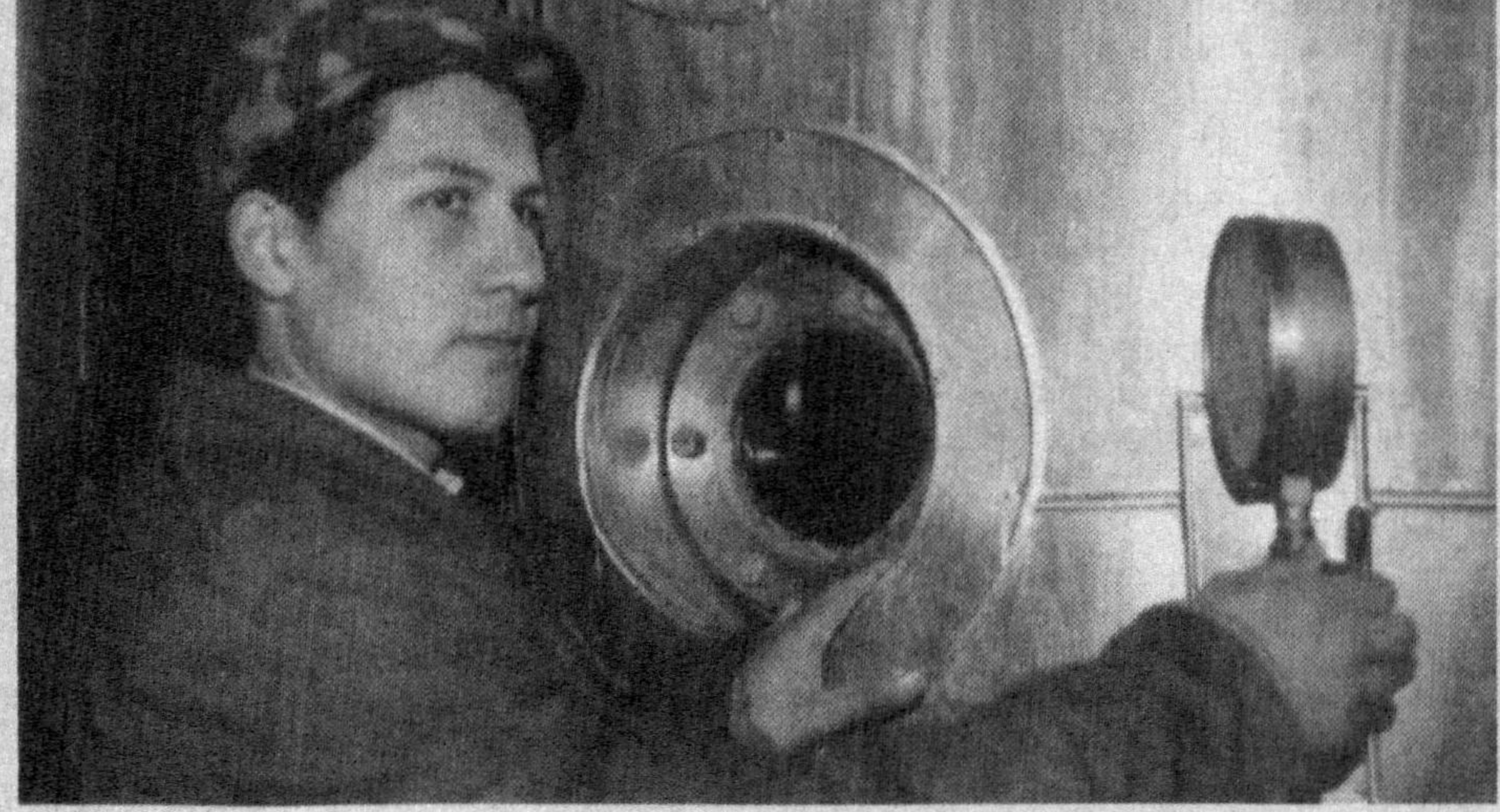
Хоразм шакар ишлаб чиқариш оқиқ ақциядорлик жамияти 1998 йилдан бунён фаолият кўрсатиб келмоқда. Халқимизни зарур маҳ-

Наманганда момиқ сочқик, халат, болалар кийимлари ва дастурхон тўқишга мўлжалланган «Бунёд» қўшма корхонаси иш бошлади. Хитойнинг Тянь Жинь шаҳридаги «Шаньхо» ишлаб чиқариш савдо компанияси ва Намангандаги «Лола-Узор» хусусий фирмаси ҳамкорликда таъсис этган корхонага хориждан келтирилган замонавий дастгоҳлар ўрнатилди. Бу ерда ойига ўн беш тонна пахта қалавасидан тайёр маҳсулот ишлаб чиқарилади. - Қўшма корхонанинги асосий мақсади янги иш ўринлари яратиш, импорт ўрнини босувчи ва экспортга йўналтирилган маҳсулот ишлаб чиқаришдан иборат, - дейди қўшма корхона директори Ш.Мирзааҳмедов. Корхонада 180 киши меҳнат қилмоқда. ЁШЛАРГА ТУҶФА Нуротада касб-хунар коллежи фойдаланишга топширилди. Педагог кадрлар тайёрлашга ихтисослашган ушбу коллежда йилга 900 нафар мутахассис тайёрланади. Бу йирки иншоотни «Навийдехқон-қурилиш» хиссдорлик жамияти қурувчилари бунёд этди. Коллеж ўттиз тўртта ўқув хонаси, олти лаборатория, кутубхона, маънавият ва маърифат маркази, иккита спорт зали, ошхона, фан кабинетлари, компьютер хонаси ва мажлислар залига эга. Коллежда Нурота туманидан ташқари вилоятнинг Томди, Қонимех, Учқудук туманлари учун ҳам педагог кадрлар тайёрланади. (У.А.)