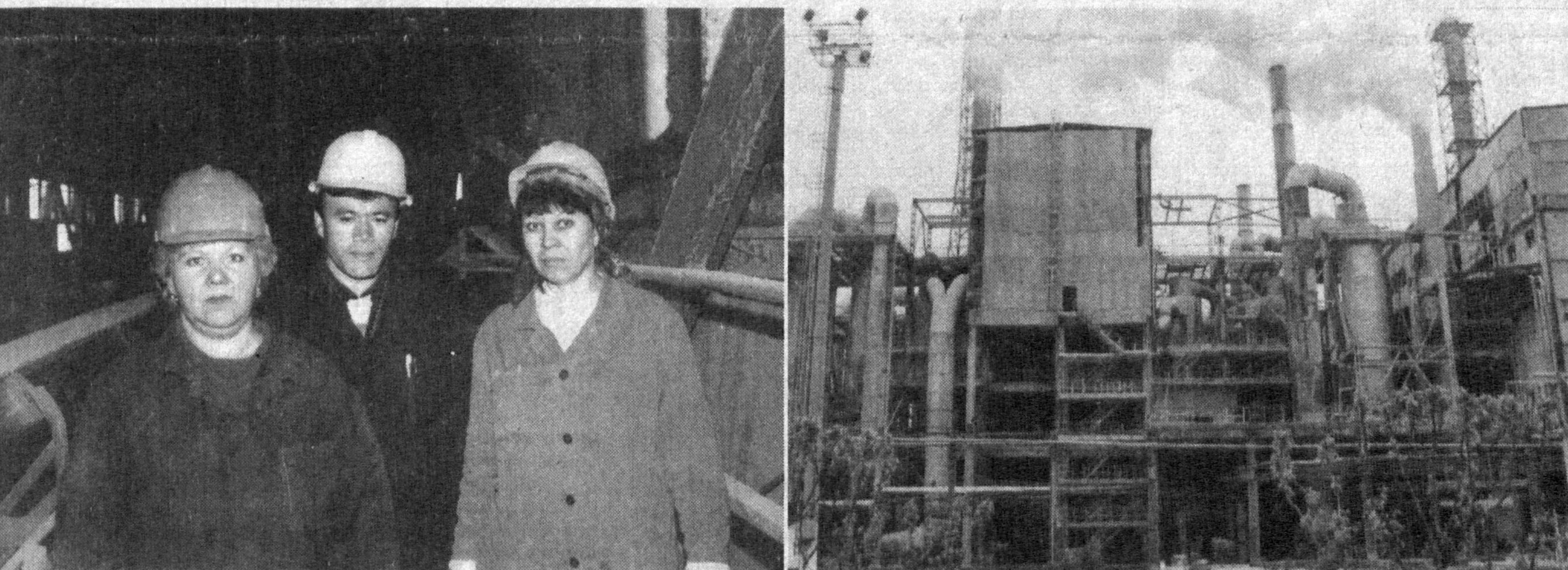
Истиқлол берган имкон