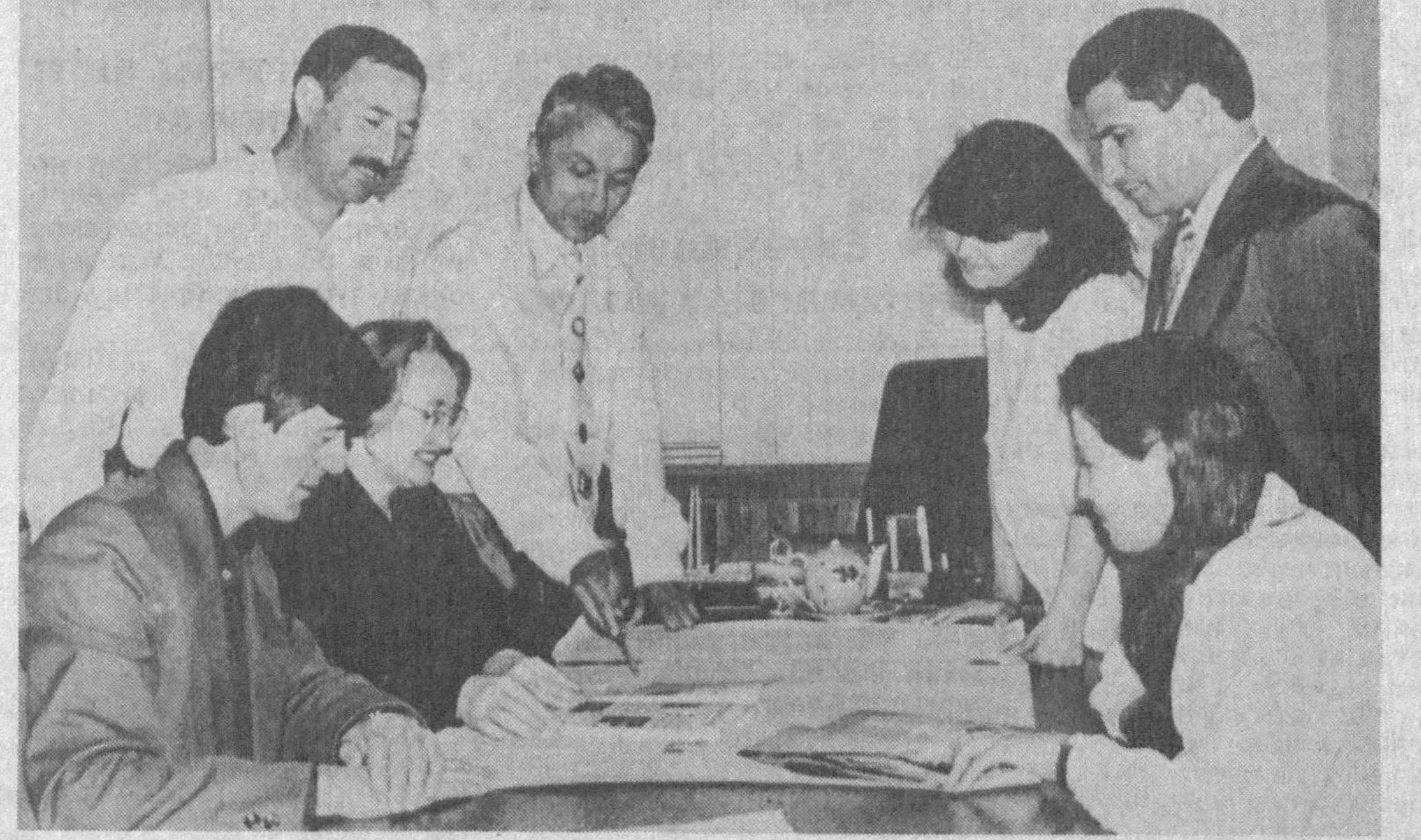
СУРАТДА: «Тафаккур» журнали жамоаси

Бугунги кунда маънавий ҳаётимизда ўзининг муҳим ўрнини тутган, ўз сўзини айтаётган нашрлардан бири «Тафаккур» журнаlidir.