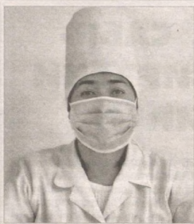
Хабарингиз бор, яқинда Президентимизнинг Фармони билан бир гуруҳ мукофотланганлар орасида фарғоналик 7 на-