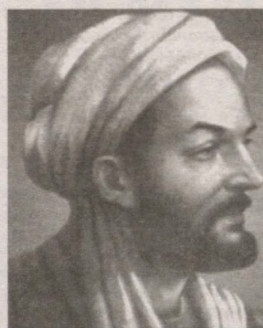
ИБН СИНО ПОЛИГРАФОЛОГ БЎЛГАНМИ?