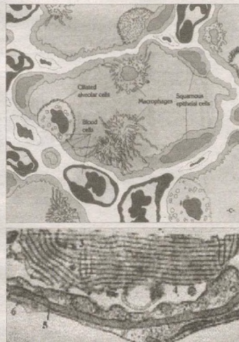
Расмларда сурфактант ва альвеоляр берилган.

Шундай қилиб, коронавирусда ўпканинг жароҳат топиши,