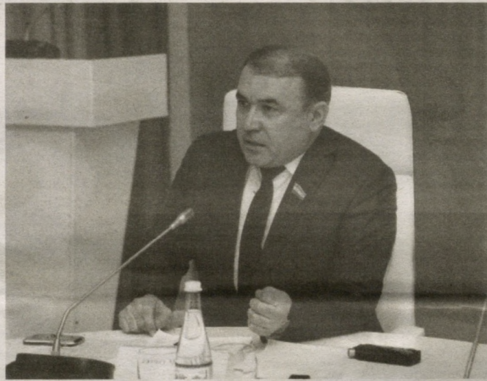
Раҳмат Маматов, Маҳалла ва оилани қўллаб-қувватлаш вазирлиги, Олий Мажлис Сенати аъзоси.

Шу муносабат билан Ўзбекистон "Маҳалла" хайрия жамоат фонди "Саховат ва кўмак" жамғармаси фаолиятини Ўзбекистон Республикаси Маҳалла ва оилани қўллаб-қувватлаш вазирлигидан мустақил ҳолда олиб бораётга-