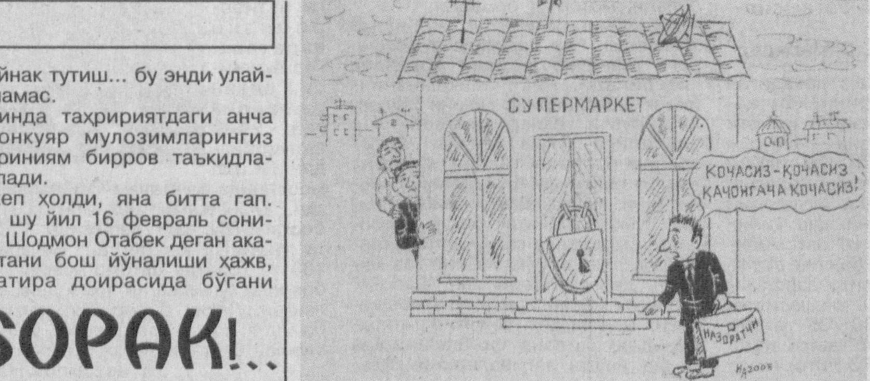
Сўзсиз сурат А.ҲАКИМОВ чизган

Оташ ХОБОНИ. Қишлоқдошлари мактубини тахририятга элтиб бериучи Абдунаби БОЙКЎЗИЕВ