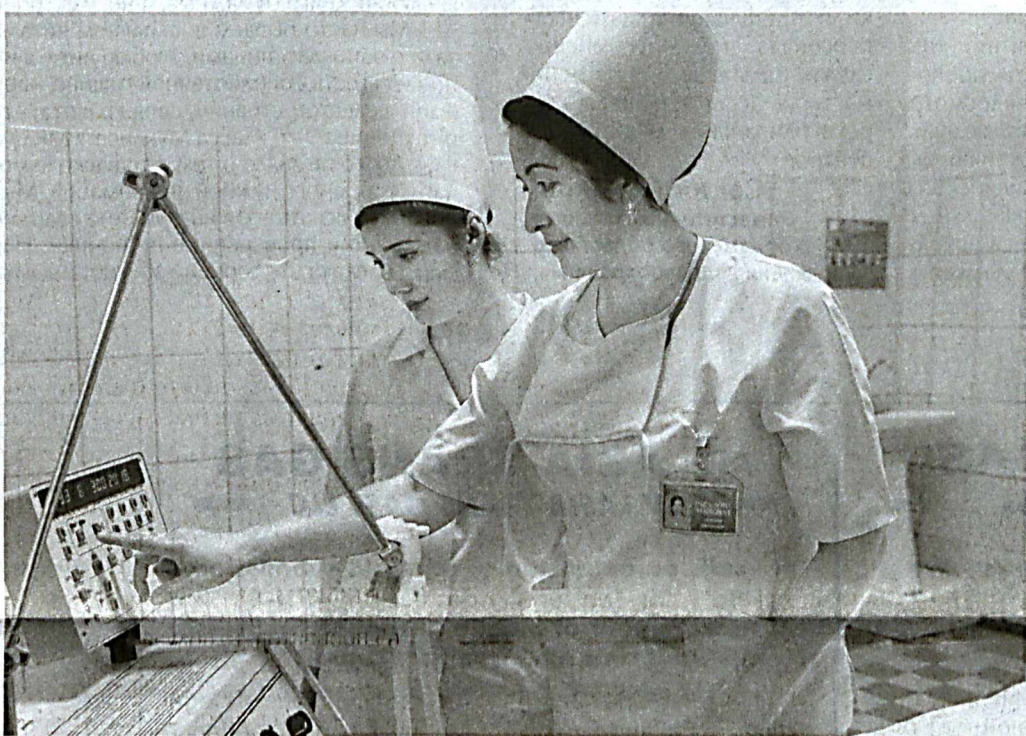
И Ферганская область.

В Ферганской областной больнице инфекционных заболеваний созданы все условия для оказания населению качественной медицинской помощи. В учреждении функционируют отделения гепатологии, реанимации, реабилитации и другие. Современное оборудование и новые методики способствуют своевременному выявлению болезней, улучшению здоровья населения и профилактике различных инфекционных заболеваний.