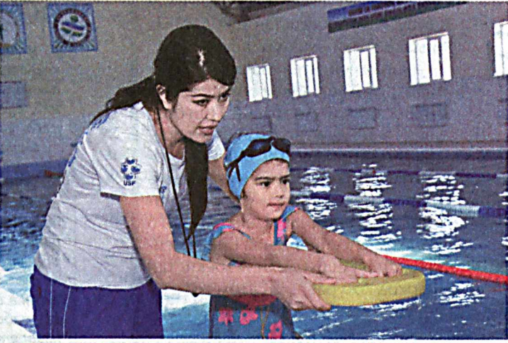
Кашкадарьинская область.

В современном водном сооружении созданы все условия для изучения техники плавания и повышения мастерства. Бассейн оснащен оборудованием для подогрева и фильтрации воды, поддержки температурного режима в помещении. Занятия в секции водного спорта посещают около 150 детей.