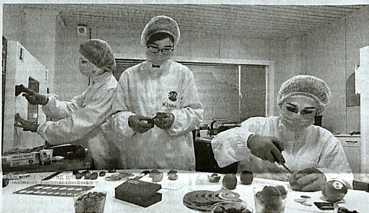
Модернизация промышленности, техническое и технологическое перевооружение производств - процесс нелегкий, требует больших капиталовложений и окупается не скоро. Но он в числе обязательных условий увеличения индустриально-экономического потенциала страны.

Данное постановление главы государства, несомненно, будет способствовать активизации деятельности по широкому внедрению в Узбекистане современных энергоэффективных и энергосберегающих технологий, обеспечит рациональное потребление энергоресурсов.