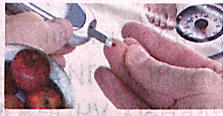
обследованию, сдать анализ крови, получить необходимую помощь.

Традиционно в ноябре в нашей стране проходит месячник борьбы с сахарным диабетом, в ходе которого проводятся различные мероприятия, нацеленные на приобщение населения к проблеме. Одно из таких - выездные "школы самоконтроля", организуемые диспансером совместно с коллегами из Республиканского специализированного медицинского центра эндокринологии и врачами-эндокринологами районных поликлиник города. Смысл этой "школы" заключается в обучении больных самостоятельному контролю за режимом питания и выполнению необходимых процедур, а также четкому следованию наставлениям лечащего врача. Помимо этого, специалисты диспансера регулярно выступают инициаторами и участниками благотворительных акций, на которых все желающие могут пройти