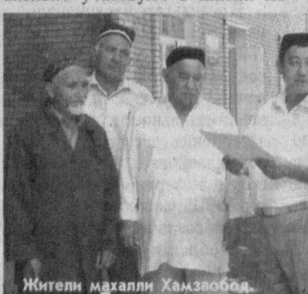
Жители махалли Хамзаобод.

Хорошо оснащен и приведен в порядок и гузар нашей махалли.