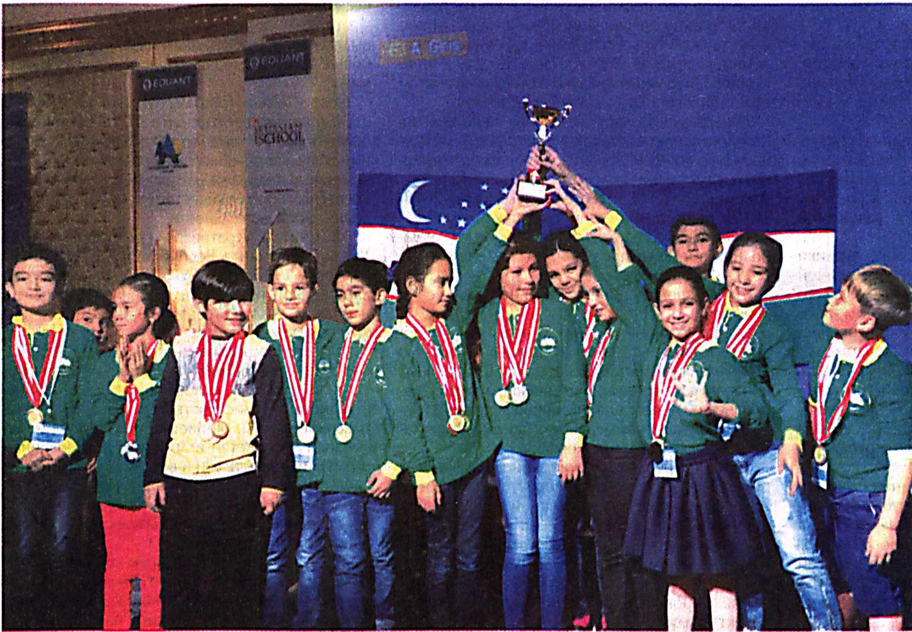
В Турции прошла IX Международная олимпиада знаний, организованная Академией туризма Анталы и Международной русской школой EDUANT. На ней успешно выступили и школьники из Узбекистана.

Команда из 25 учащихся негосударственного образовательного учреждения сада-школы "Intellect" завоевала 6 золотых, 20 серебряных и 23 бронзовые медали - всего 49 наград. В общекомандном зачете школа "Intellect" завоевала 1-е место и получила 4 кубка по четырем предметам: математике, русскому и английскому языкам, изобразительному искусству.