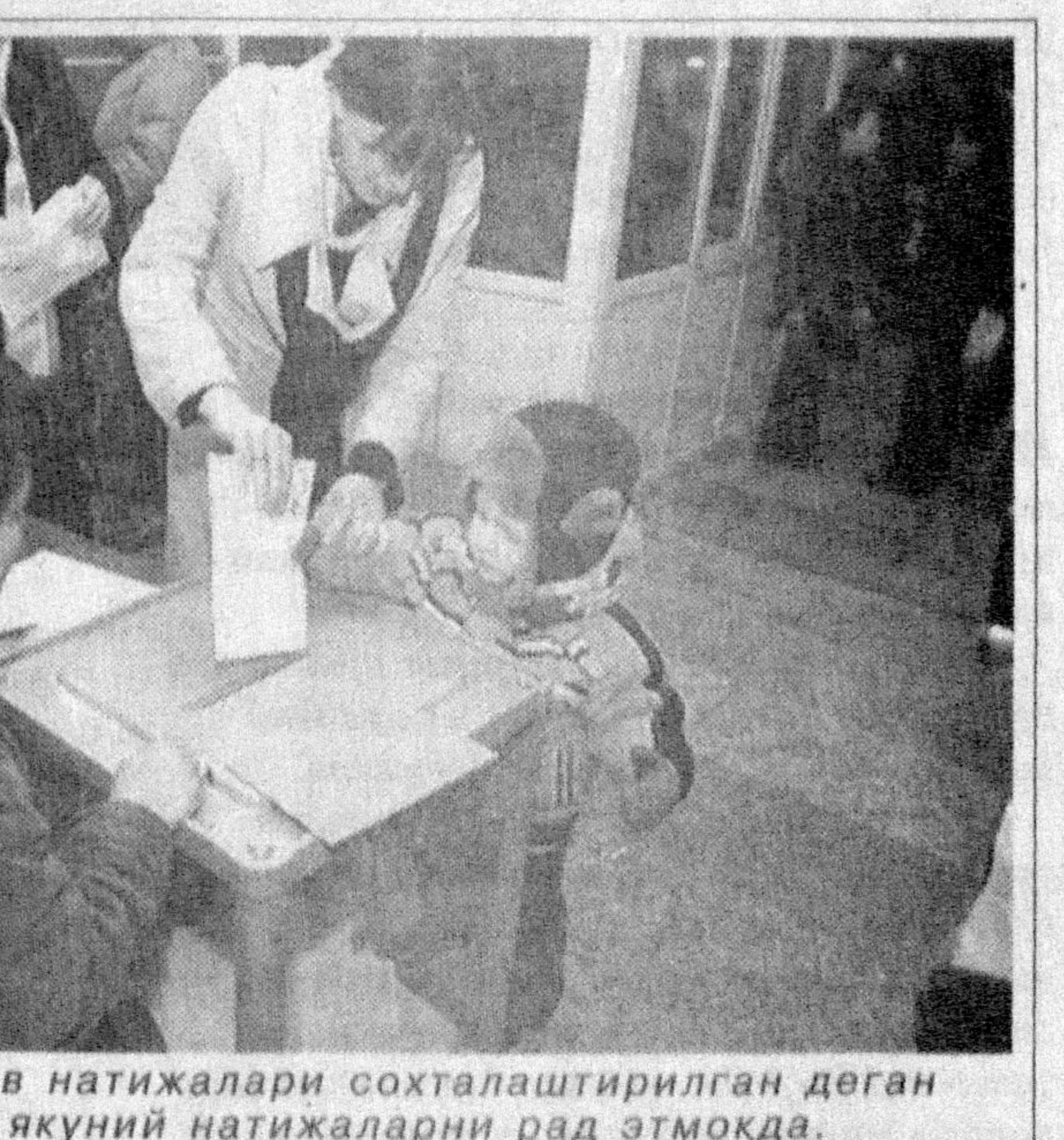
Муҳолифат сайлов натижалари сохталаштирилган деган даъво билан якуний натижаларни рад этмоқда.