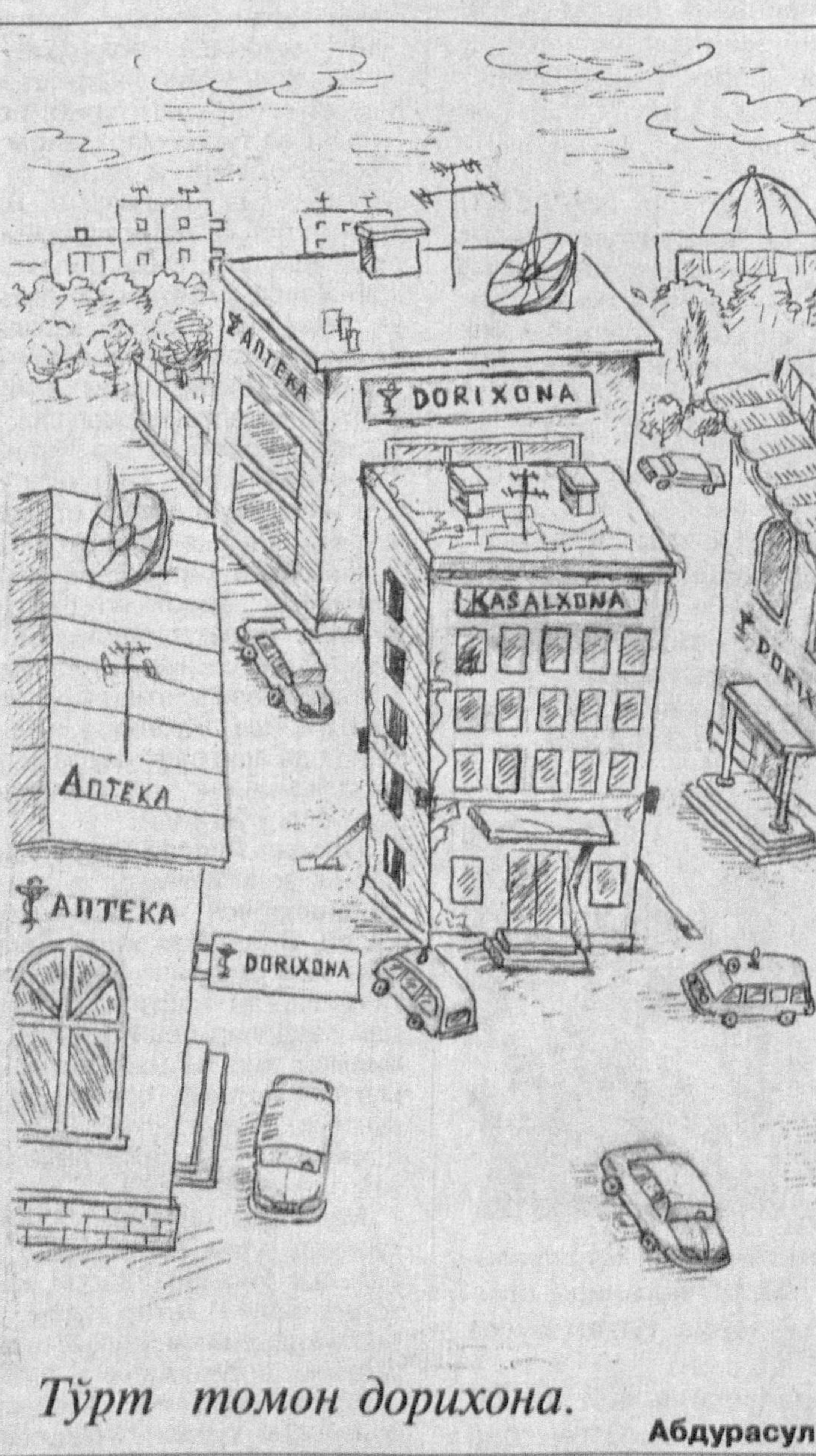
Тўрт томон дорихона. Абдураул ҲАКИМОВ чизган сурат.

Мухаммад Раҳимхон Ферузинг яхши бир одами бор эди. У гоҳ-гоҳо арқони давлат билра шаҳар айланар, аҳли раи-ятнинг ҳолидан хабар оларди. Бир кунни хон маҳрамлари ила шаҳар сайрига чиқди. Енида хо мулозимни Ҳасан қайғичи ҳам бор эди.