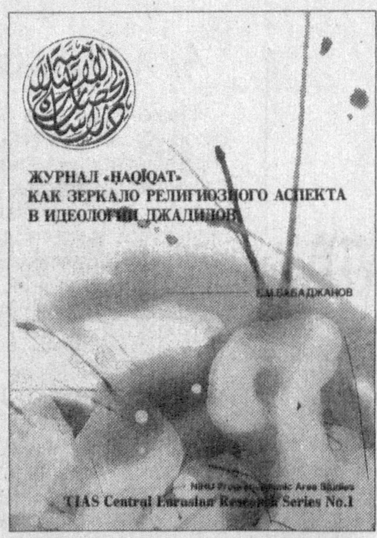
ЖУРНАЛ «ҲАҚИҚАТ» КАК ЗЕРКАЛО РЕЛИГИОЗНОГО АСПЕКТА В ИДЕОЛОГИИ ДЖАЛИЛОВА

Маърифатпарвар оталаримиз ўтган асрнинг 20-йилларида халқнинг “кўзини очиш”, уларни илм, фандан баҳраманд этиш мақсадида бир қанча журнал ва газеталар нашр қилдилар.