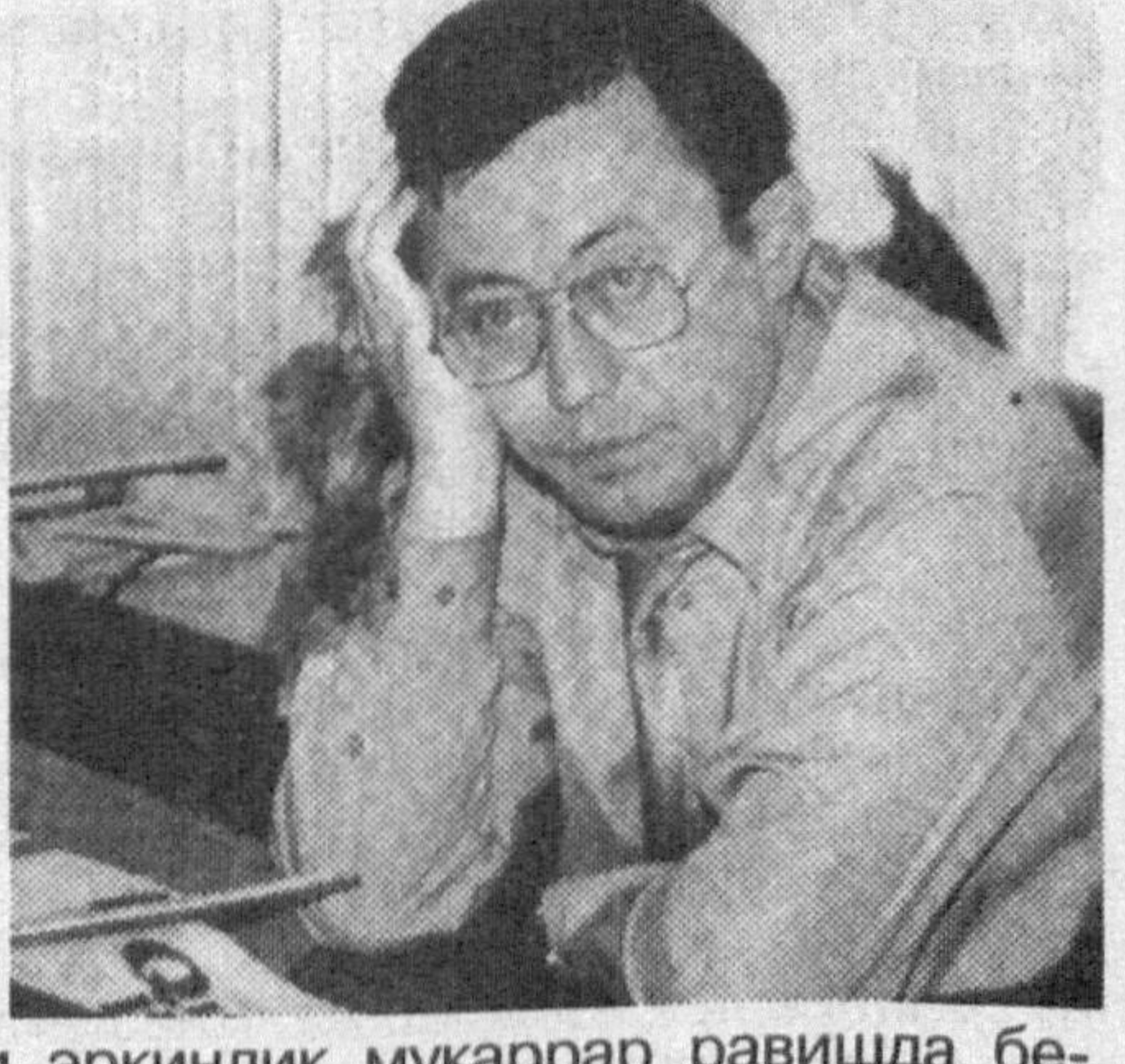
Матбуотимизни янада ривожлантириш уфқини қайси ўлчамларда кўрасиз? Ўзбек матбуотида танкид қандай ўрин тутиши керак, деб ўйлайсиз? Шундай қилиб, Сизни мулоқотга чорлаймиз.

берадиган кўплай меъёрий ҳужжатлар қабул қилинган. Энди асосий гап ҳуқуқий дастурларда кўзда тутилган эркинлик ва мажбуриятларни қай даражада амалда ижро этишдадир.