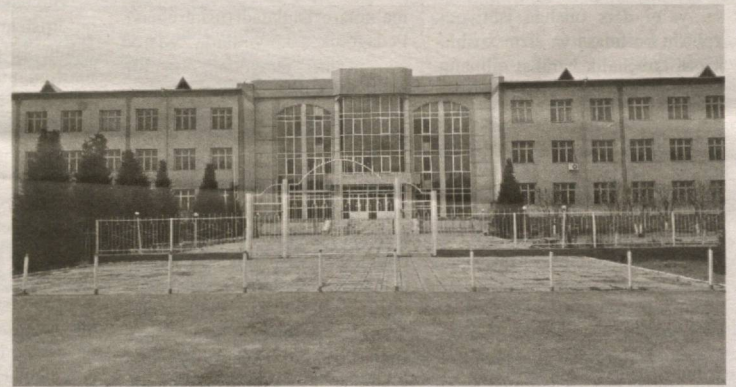
18-maktab yonida sobiq Chortoq ijtimoiy-iqtisodiyot kollejining butun boshli binosi bo'sh turibdi.

Endi e'tiboringizni yana bir inshootga qaratmoqchimiz. 18-maktab yonida sobiq Chortoq ijtimoiy-iqtisodiyot kollejining butun boshli binosi bo'sh turibdi. 2019-2020-o'quv yili boshlanishida mazkur kollej binosi 18-maktabga "tuhfa" etildi. Maktab o'quvchilari sentabr-oktabr oyida shu yerda o'qishdi. Keyin Namangan muhandislik texnologiyalari