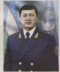
Генерал-майор Собиров Шухратжон Уринбаевич

Ўзбекистон Республикаси Ички ишлар вазирининг биринчи ўринбосари лавозимига