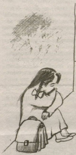
Бегали Эшонқулнинг чизмаси бўлиб қолган.