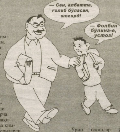
Бегали Эшонқулов чизган сурат.

Орадан икки кун ўтиб, устозимдан билимлар беллашувида юқори ўрин олган ўқувчиларга совға берилиши, мен ҳам қатнашим кераклигини эшитдим. У ерда барча ўрин олганлар ўртага қақарилиб, фахрий ёрлиқ ва қимматбаҳо совғалар бериларди. Қилган ишим эсимга тушиб, “борсам, мени қақариб, шармандамни чиқаради”, деган ўйда устозимизга бормаглигимни айтдим. Устоз қўярда-қўймай, билагимдан судрагудек олиб кетди. Йўл-йўлакай ўрин олганим, қақирса, чиқишимни айтди.